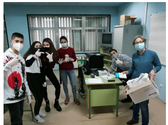
Grupo de alumnos organizadores

De hecho, en la pasada Nochebuena, un grupo de estos alumnos procedieron a pesar a uno de los miembros del equipo de ventas del Lidl de la calle Villabáñez, 3. La cifra de su peso se transformó en mascarillas con logos navideños que provocaron sonrisas y alegría en las personas sin hogar que, ese día, acudían al Centro de Higiene y al Comedor solidario de Cáritas diocesana regentado por los padres Paules.