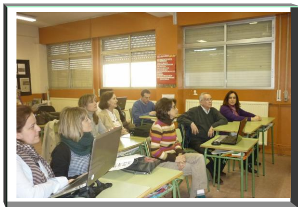
Grupo Seminario WEB 2.0

En el blog aparecerán noticias, publicaciones, eventos, convocatorias, citas..., relacionadas con la enseñanza, así como vuestras participaciones y cuestiones de interés educativo.