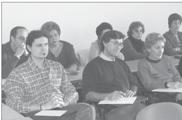
Participantes en el Seminario.

• Hay tres líneas a seguir para abordar la situación: