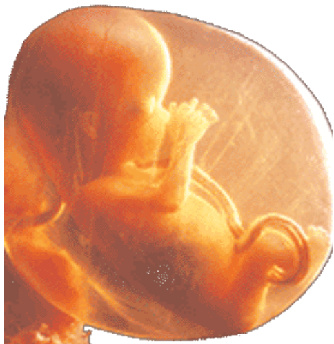
Feto de veintiséis semanas de vida

En España la interrupción voluntaria del embarazo está permitida hasta las 22 semanas de gestación. Para entonces el feto mide ya 25 centímetros y pesa casi un kilo. Éstas son las fases de la gestación.