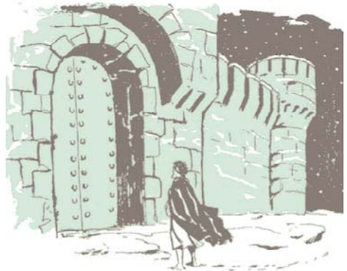
Enrique IV, descalzo sobre la nieve, a las puertas del Castillo de Canossa

2ª. Enrique IV, que se hab3a humillado y arrepentido con hipocres3a, combati3 y derrot3 a sus enemigos de Alemania y con un eficiente ej3rcito entr3 en Roma , obligando al Papa a refugiarse en el Castillo de Sant’Angelo, del que le libr3 el