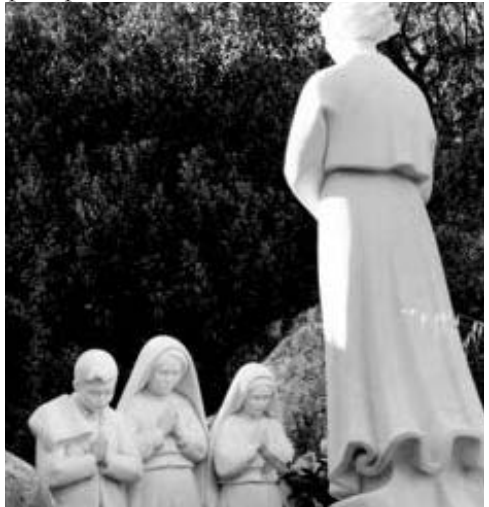
Monumento en Loça do Cabeço al ángel en la tercera aparición

¡Oh, Trinidad santa, a quien yo adoro, a quien yo amo, a quien yo he de cantar etema alabanza! En mí, ¡tú eres luz, eres gracia, eres amor! Me sumerjo en ti y me precipito en el amor de tu ser.