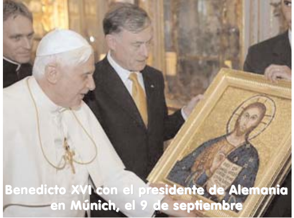
Benedicto XVI con el presidente de Alemania en Múnich, el 9 de septiembre

Lo ha sido, por ejemplo, la entrevista concedida a la televisión alemana con la que preparaba esta visita. En ella, quizá más que nunca hasta ahora, se ha visto el matiz que el Papa quiere imprimir a su labor pastoral, en comparación con su predecesor. No se trata de un cambio de línea y mucho menos de un enfrentamiento. Es, simplemente, acentuar más algo que ya estaba antes pero que quizá, por circunstancias ajenas a la voluntad de Juan Pablo II, quedaba ligeramente ensombrecido. «El catolicismo no es un conjunto de prohibiciones, sino una opción positiva —decía el Papa en la entrevista—. Y es muy importante que esto se vea nuevamente, ya