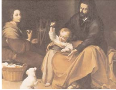
SAGRADA FAMILIA DEL PAJARITO (MURILLO)

jóvenes, someteos a los presbíteros. Y todos, revestíos de humildad en el trato mutuo, porque Dios resiste a los soberbios y a los humildes da su gracia. Humillaos, pues, bajo la mano poderosa de Dios, para que a su tiempo os exalte. Descargad sobre Él todas vuestras preocupaciones, porque Él cuida de vosotros» (1 P 5, 5-8).