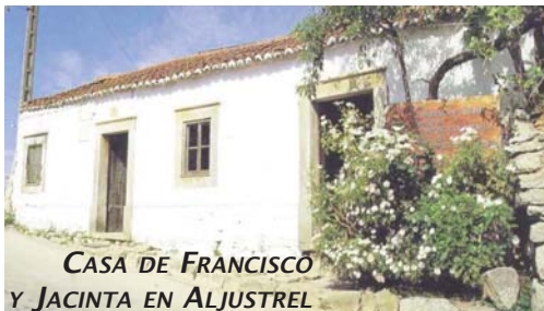
CASA DE FRANCISCO Y JACINTA EN ALJUSTREL