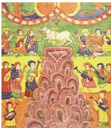
“EL CORDERO SOBRE EL MONTE SIÓN”, DEL BEATO DE VALCAVADO

Aquí, el Cordero es Cristo; los que le acompañan por todos lados son las personas vírgenes. La virginidad es el fruto de aquel amor con el que las personas se consagran en plenitud a Cristo: se dan sin reservas, se entregan sin límites, para siempre. A ellas se refirió Cristo, cuando dijo: «En efecto, hay eunucos que así nacieron del seno de su madre; también hay eunucos que así han quedado por obra de los hombres; y los hay que se han hecho tales a sí mismos por el Reino de los Cielos. Quien sea capaz de entender, que entienda» (Mt 19, 12). La virginidad es un don de amor puro, que se eleva todo y sólo para Dios; es el lazo de la más estrecha unión con Dios, es aquel lenguaje de amor puro que no fue concedido a todos comprender, como dice Jesús: «Él les respondió: No todos son capaces de entender esta doc-