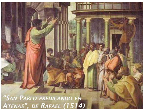
“SAN PABLO PREDICANDO EN ATENAS”, DE RAFAEL (1514)

ga, “interiormente indignado al ver la ciudad llena de ídolos”. Predica tanto en la sinagoga como en la plaza –incluso en el Areópago– suscitando de este modo la curiosidad de intelectuales, “epicúreos o estoicos”. Allí les habla, no solo de Dios Creador de todos y de todo, sino también de como Él tiene fijado el día en que va a juzgar al mundo según justicia por el Hombre que ha destinado, dando a todos una garantía al resucitarlo de entre los muertos. Al oír esto, unos se burlan y otros dicen: “Sobre esto ya te oiremos otra vez”. Únicamente se convierten Dionisio,