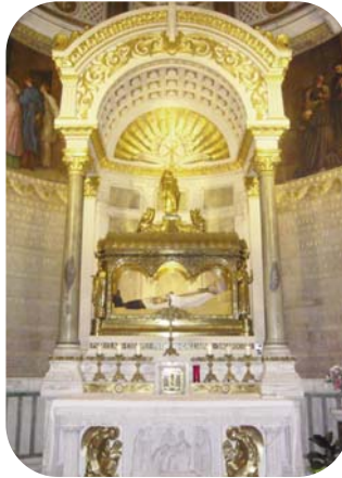
SEPULCRO DEL CURA DE ARS

H e dedicado mis dos primeras cartas a glosar la que Benedicto XVI nos escribió a los sacerdotes, como inicio del Año Sacerdotal . El mes pasado expuse una pequeña semblanza de la vida del santo Cura. A partir de hoy me parece muy conveniente exponer, citar y comentar su doctrina tan excelente, recogida por testigos de su vida, y también la contenida en sus Sermones. Tales expresiones son para leerlas pausadamente y mejor ante el sagrario donde está verdadera, real y sustancialmente presente Jesucristo.