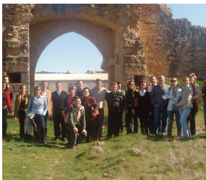
Los participantes en el retiro espiritual descansan después de comer y pasean por uno de los rincones más singulares de Villagarcía de Campos

El día concluyó con la celebración de una Eucaristía Familiar , a la que se unieron los hijos de los matrimonios y los monitores que estuvieron todo el día con ellos. En dicha Eucaristía, se dio gracias