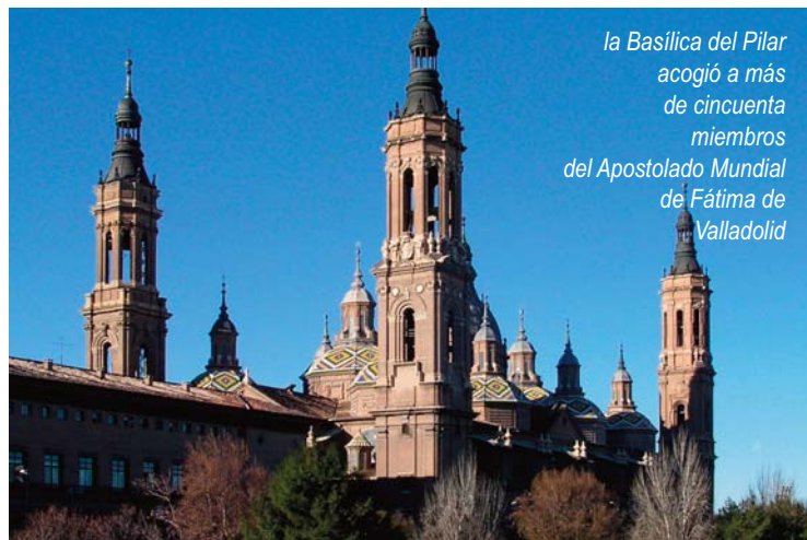
la Basílica del Pilar acogió a más de cincuenta miembros del Apostolado Mundial de Fátima de Valladolid

Una jornada agradable en la que disfrutaron del arte románico de la Iglesia de Santo Domingo y de la belleza de los parajes en los que está situada la Ermita de San Saturio, patrón de la ciudad.