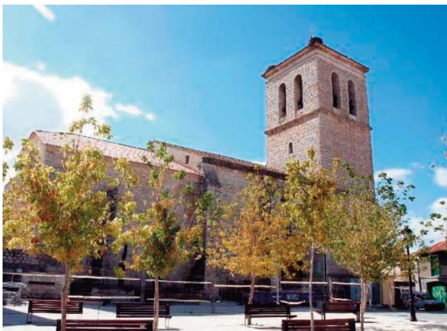
Iglesia de San Juan Evangelista, de piedra, del siglo XVI. Destaca su portada principal, renacentista, en la que sobresale la imagen de San Juan dentro de una hornacina.

El arciprestazgo Tudela-Portillo abarca parte de los alrededores de Valladolid y algunos otros pueblos entre Cuéllar y Peñafiel y consta de 25