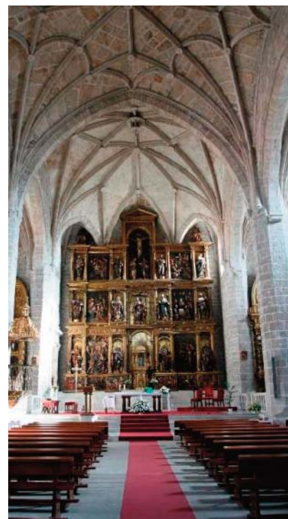
Retablo de la Iglesia Nuestra Señora de la Asunción de Tudela de Duero. Gracia a él, este templo de tres naves con planta de salón, es una auténtica joya.

En lo que se refiere al nivel de actividades arciprestales no tenemos nada que mencionar, sí en cada una de las parroquias donde no cabe duda que cada uno de los sacerdotes se esfuerza en mejorar día a día y hay numerosas actividades como: Cáritas, Cursillos prematrimonia-