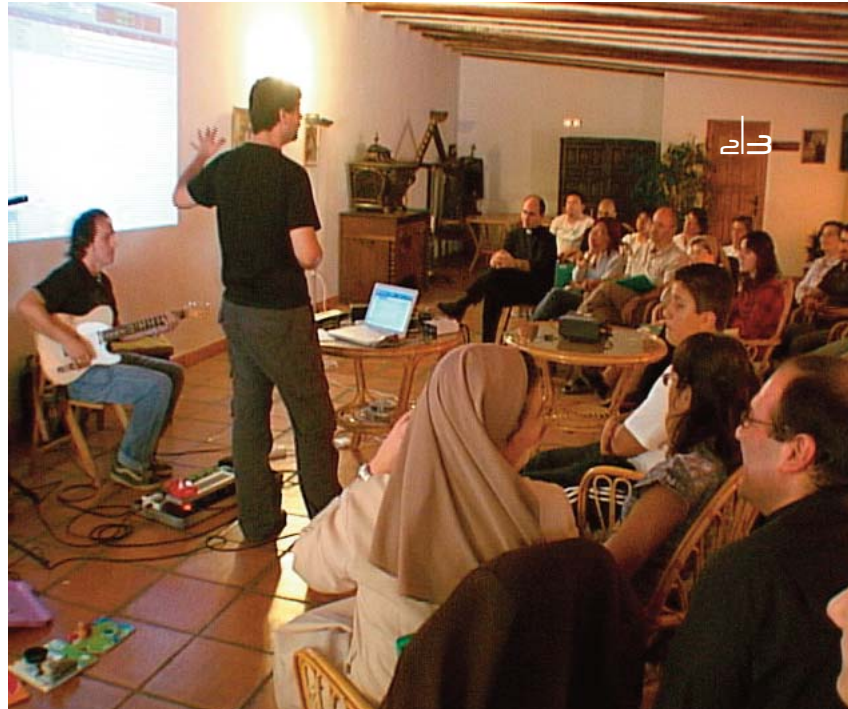
Los asistentes al Encuentro participan en uno de los talleres musicales

El octavo Encuentro de Música y Evangelización ponía punto y final el pasado domingo, 27 de septiembre, con la “Melodía del Corazón de Cristo III. La esperanza