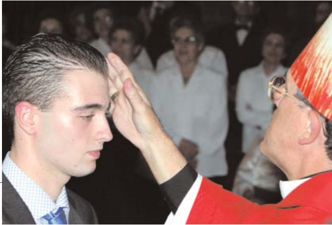
Texto: Pedro Herráiz

● “Los confirmados, encargados por Dios, tienen la obligación y gozan del derecho de trabajar para que el mensaje divino de la salvación sea conocido y recibido por todos los hombres y en toda la tierra”.