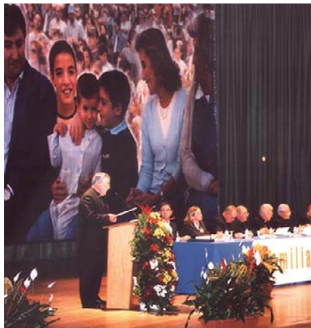
Encuentro Nacional de Familia. CEE.

Entre las acciones formativas programadas para este curso destacan: la Escuela de Formación para Agentes de Pastoral Prematrimonial, los Cursos Prematrimoniales y la XX Semana de la Familia. Otras acciones como el Encuentro Diocesano de Pastoral Prematrimonial, el apoyo a la Plataforma de la Familia, el