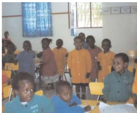
Un momento de descanso en la escuela salesiana en Gambo