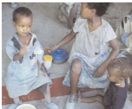
Niños alimentándose gracias al proyecto de emergencia de alimentos en Zway