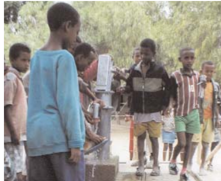
Jóvenes sacando agua de un pozo financiado por Manos Unidas en la localidad de Zway

Texto: Ana Martín Hernando