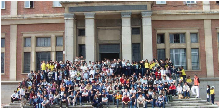
Jóvenes en la Jornada Diocesana de la Juventud de 2003.

Alicia Villa. El Seminario Diocesano de Valladolid acogerá la 14ª Jornada de la Juventud, que desde sus inicios se propuso como un encuentro de jóvenes para celebrar juntos la fe. Dos momentos concentran el interés de la Jornada: la Vigilia de Oración, que este año cuenta con la participación del Coro Diocesano Juvenil , y el Festival Joven, que este año cumple su 7ª edición.