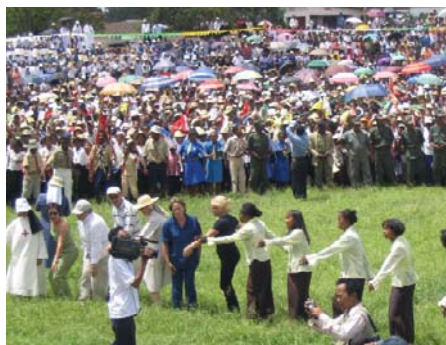
Más de 10.000 personas asistieron al acto