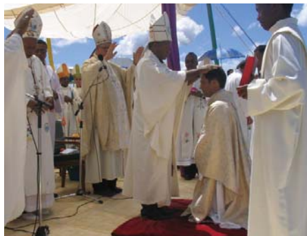
Momento de la imposición de manos