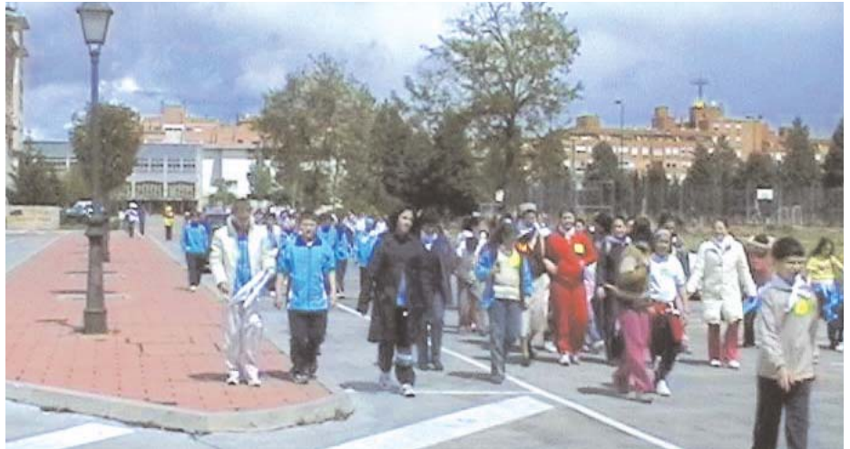
Los participantes en el encuentro inician la marcha desde el Seminario.

A lo largo del mes de mayo la Delegación de Manos Unidas ha organizado diferentes cursos de formación en los que han participado unas cincuenta personas. El primer curso versó sobre los Derechos Humanos y la Doctrina Social de la Iglesia. El segundo trató sobre la Ética y la Economía. Por otro lado, el 3 de junio tendrá lugar la presentación del material educativo para el nuevo curso 2004-2005 que se desarrollará en el marco de la globalización ■