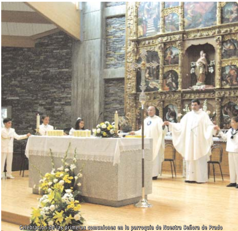
Celebración de las primeras comuniones en la parroquia de Nuestra Señora de Prado