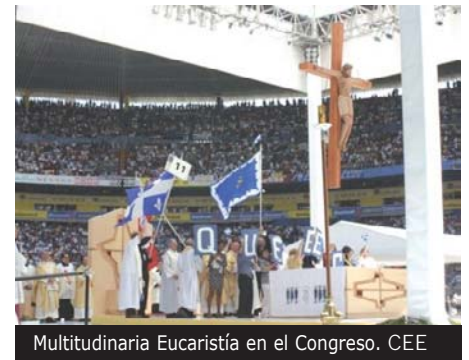
Multitudinaria Eucaristía en el Congreso. CEE

Las conclusiones del Congreso insisten en la necesidad de fortalecer el espíritu de la misión y de compartir con los pobres la mesa y la misa. Durante el Congreso, se dio lectura a la Carta