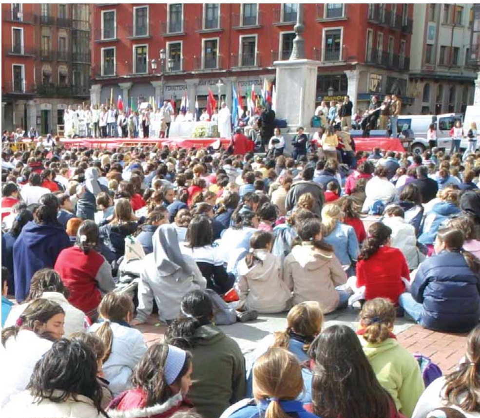
Los fieles abarrotan la plaza Mayor durante la celebración de la Eucaristía misionera.

Este año, la festividad de la Inmaculada Concepción de María, que se celebra el 8 de diciembre, coincide con el 150º aniversario de la proclamación del Dogma. Así lo estableció, en 1854, el Papa Pío IX, quien reconoció, de este modo, que Nuestra Señora fue concebida sin pecado original. La proclamación del Dogma por parte del Sumo Pontífice fue recibida con alegría por católicos de todo el mundo dada la devoción que se profesa a la figura de la Virgen desde hace siglos entre la cristiandad. Hasta diciembre del año 2005, la Iglesia católica de España, promotora de la declaración Dogma, celebrará numerosas actividades conmemorativas.