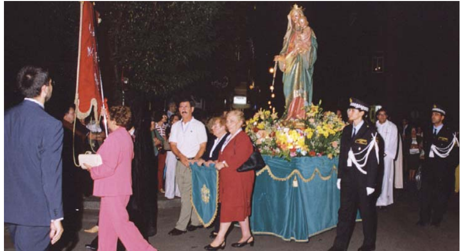
Cientos de fieles participan en la procesión de la Virgen del Rosario por las calles de la Rubia.

En Valladolid, Cáritas Diocesana atendió a lo largo del año 2003 a 2.120 personas, para lo que invirtió en el programa de Personas Sin Techo 120.510,12 euros en el Servicio de Acogida, en el Centro de Día "José María Lacort" y la Casa de Acogida "El Cauce" ■