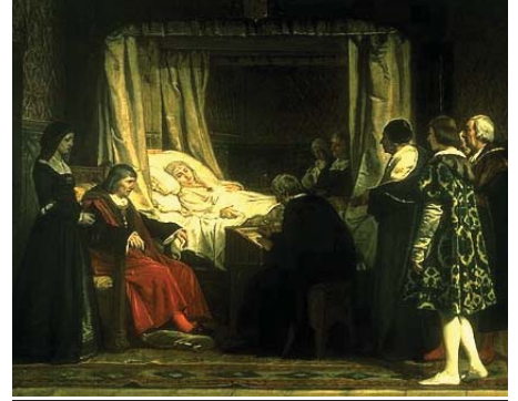
«El testamento de la Reina Isabel la Católica», óleo de Eduardo Rosales (s. XIX)