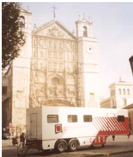
El punto de hemodonación en San Pablo.