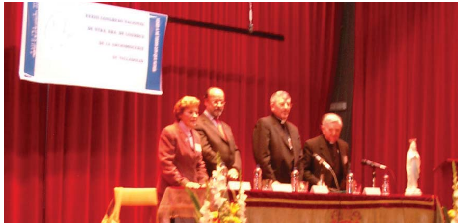
La presidenta nacional, el alcalde, el arzobispo y el consiliario diocesano en la inauguración. MCS

Durante la primera quincena de diciembre se podrá visitar en el Centro Cívico Juan de Austria (Pº Zorrilla) la exposición "El ajuar de la abuela", en la que todas las zonas de Valladolid estarán presentes con una muestra de labores tradicionales. El objetivo es hacer más intensa la relación de las diversas zonas de la diócesis para una mejor coordinación de las actividades de nuestra Delegación de Manos Unidas ■