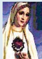
San Luis de Monfort (1716)

Dos casas tuvo Dios en este mundo señaladas entre todas las otras. La Una fue la humanidad de Jesucristo, en la cual mora la divinidad de Dios corporalmente, como dice el Apóstol (Col 2, 9) y la otra, las entrañas virginales de Nuestra Señora, en las cuales moró por espacio de nueve meses. Estas dos casas fueron figuradas en aquellos dos templos que hubo en el Viejo Testamento, uno de ellos que hizo Salomón (1R 7,1) y el otro que se edificó en tiempo de Zorobabel, después del cautiverio de Babilonia (Esd 6,17).