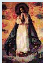
J. Pascher (1967)

Los primeros indicios de esta fiesta hay que buscarlos en Oriente durante los siglos VII u VIII. En Occidente aparece en la Italia meridional, en la región habitada por los bizantinos. La celebración tardó en difundirse a causa de la lenta penetración de la teología en este misterio mariano. En Roma entró en el calendario litúrgico en 1476. La fecha elegida está en relación con el 8 de septiembre, la fiesta de la Natividad de la Virgen, más antigua, una dependencia similar a la de la Anunciación del Señor y la Navidad.