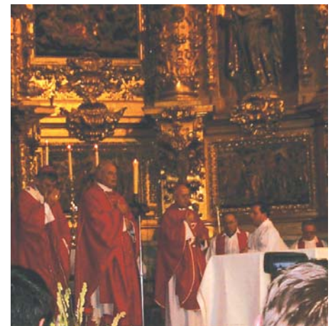
Momento de la misa de acción de gracias.