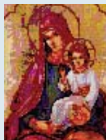
F. Luis de Granada (s. XVI)

En la fiesta de la concepción de María, que la Iglesia celebra el 8 de diciembre -9 meses antes del 8 de septiembre- se trataba también originariamente de la conmemoración de un suceso, la concepción precisamente de María en el seno de su madre. Anselmo de Canterbury (+1109) introdujo en su diócesis una fiesta de la Conceptio Beatae Mariae Virginis, movido tal vez ya entonces por la fe de que María había sido concebida sin pecado " ante ipsam conceptionem mundata " (limpia antes de su concepción).