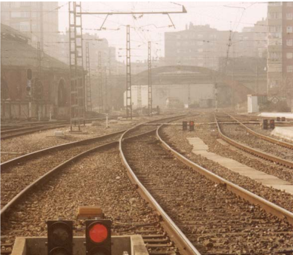
El Adviento, por esperanza, es tiempo de preparación, de anuncio de la llegada del Hijo de Dios