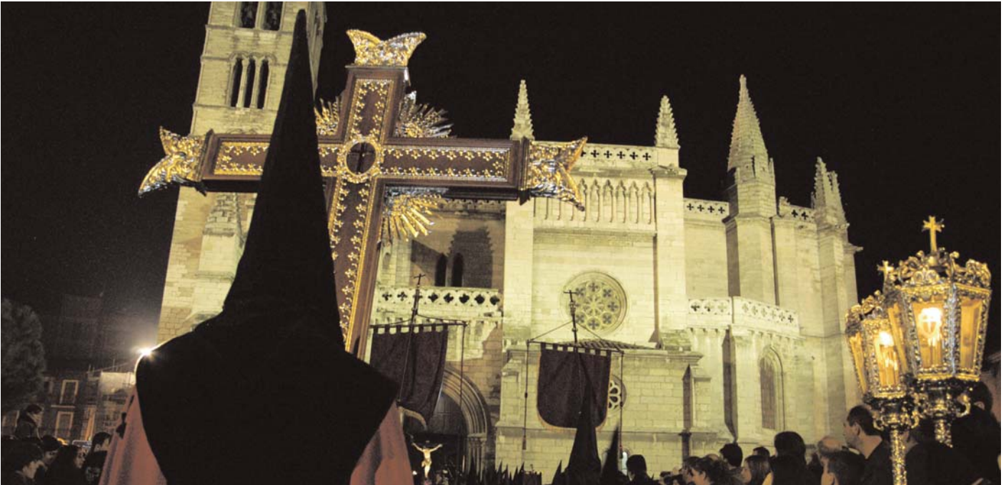
El Cristo del Olvido sale de La Antigua el Lunes Santo, en la procesión de la Buena Muerte.

La Semana Santa vallisoletana cuenta con algunas de las mejores imágenes de la Escuela Castellana, obra de maestros como Juan de Juni o Gregorio Fernández, que hacen de la de Valladolid la Semana Santa más completa del mundo cristiano.