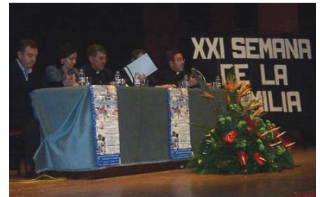
Inauguración de la XXI Semana de la Familia.

Esta conferencia trató el ideal de la moderni-