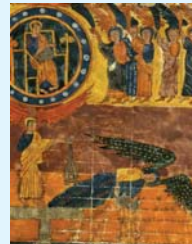
3. EXTERMINIO DE NACIONES PAGANAS