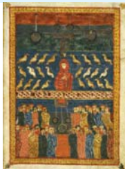
2. EL CASTIGO DE BABILONIA