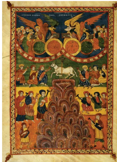
El cordero en el Monte Sión Miniaturas procedentes del Beato de Valcavado de la Biblioteca Histórica de Santa Cruz (UVA)

Todos estamos invitados a rendir sincero homenaje a todas las Víctimas del Terrorismo asistiendo a un Concierto de Música que busca transformar la oscuridad en luz, que aleja de nosotros los fantasmas de la destrucción y presenta ante nuestros ojos un futuro de esperanza por el que valga la pena recuperar la ilusión de vivir y el sentido de hacer el Bien ■