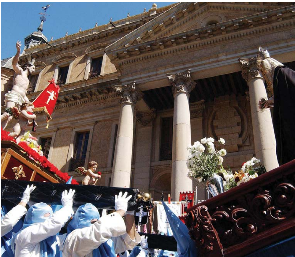
Encuentro de Jesús Resucitado con la Virgen de la Alegría en Salamanca.