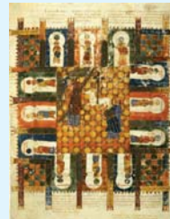
4. LA JERUSALÉN FUTURA