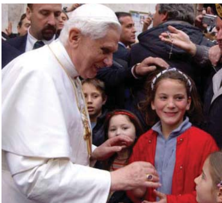
El Sumo Pontífice saluda a un grupo de niños en las inmediaciones de la plaza de San Pedro

La palabra "cónclave" procede de la expresión latina "cum clavis", que a su vez significa "bajo llave", haciendo referencia a los inicios de esta institución hacia 1241, cuando Mateo Rosso Orsino encierra a los electores en el palacio romano del Septizonium para apresurar la obtención de resultados. La gran anécdota y origen propiamente dicho del Cónclave tuvo lugar en 1271 en Viterbo (Italia), cuando, tras tres años de deliberaciones y votaciones, los nobles de la ciudad deciden encerrar a los cardenales electores y el pueblo les arranca el tejado, hecho este que aparece justificado en las crónicas de la época, afirmando que el cardenal Juan de Toledo había aconsejado abrir el techo para dejar entrar al Espíritu Santo. El resultado fue la rápida elección de Gregorio X, cuyas primeras normas fueron las destinadas a la elección de sus sucesores: se haría siempre a puerta cerrada y limitando los privilegios de los cardenales.