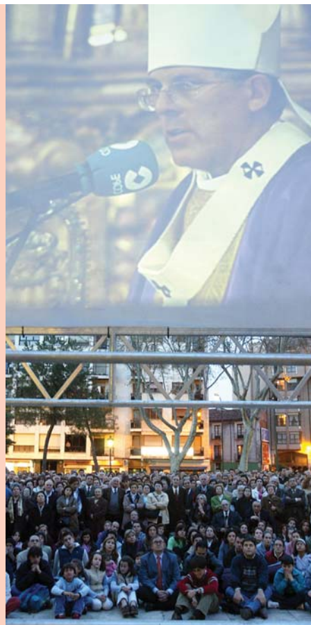
Miles de personas siguen en la calle el funeral por el papa Juan Pablo II.

El arzobispo, a través de este comunicado, destaca muy especialmente las facilidades concedidas por el Ayuntamiento, representado por su alcalde-presidente, Francisco Javier León de la Riva, a la hora de organizar el funeral, el pasado martes, día 5, en la Santa Iglesia Catedral Metropolitana. Así mismo, reconoce la labor realizada por Policía Municipal, Cuerpo Nacional de Policía, Protección Civil, Cruz Roja Española y otros colectivos y personas que velaron, durante horas, por la seguridad de todos los ciudadanos ■