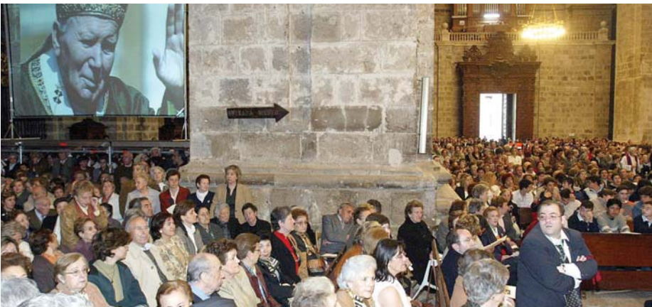
Los fieles abarrotan la catedral en el funeral celebrado tras la muerte de Juan Pablo II.

R.S/B.S. El Papa Juan Pablo II murió el sábado 2 de abril a las 21:37 horas. El llamado Papa viajero o Papa de los jóvenes nos dejó tras ejercer un papado de 26 años, el más largo del siglo XX. A lo largo de este tiempo, Karol Józef Wojtyła se convirtió en una figura social: sus actuaciones contra el comunismo, su condena a cualquier tipo de guerra y su papel definitivo en favor de los más pobres. "El mundo ha perdido un campeón de la libertad. En su Polonia natal lanzó una revolución democrática que sacudió la historia en el este", declaró el presidente de Estados Unidos, George W. Bush.