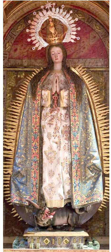
Inmaculada Concepción de Gregorio Fernández (s. XVII) Monasterio de Santa Clara de Valladolid