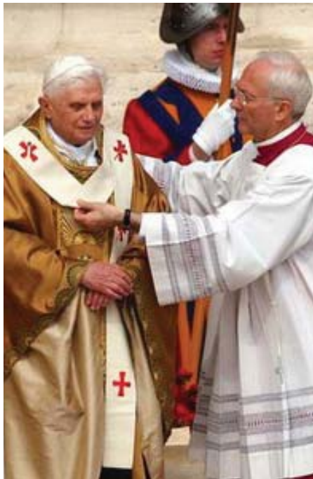
Benedicto XVI recibe el palio en la Misa de entronización

En la actualidad, tanto los cónclaves que se celebraron en el siglo pasado como éste que ha elegido a Benedicto XVI, continúan celebrándose a puerta cerrada y en un clima de aislamiento máximo que trata de garantizar la libertad de conciencia de los electores, sin presión ni influencia alguna del exterior. En este sentido, el anterior pontífice promulgó en 1996 la constitución apostólica "Universi Dominici Gregis" con una serie de normas meticulosas, contemplando no solo el factor humano, sino también los grandes avances tecnológicos que ofrece este siglo: teléfonos móviles, minicámaras, microtransmisio-