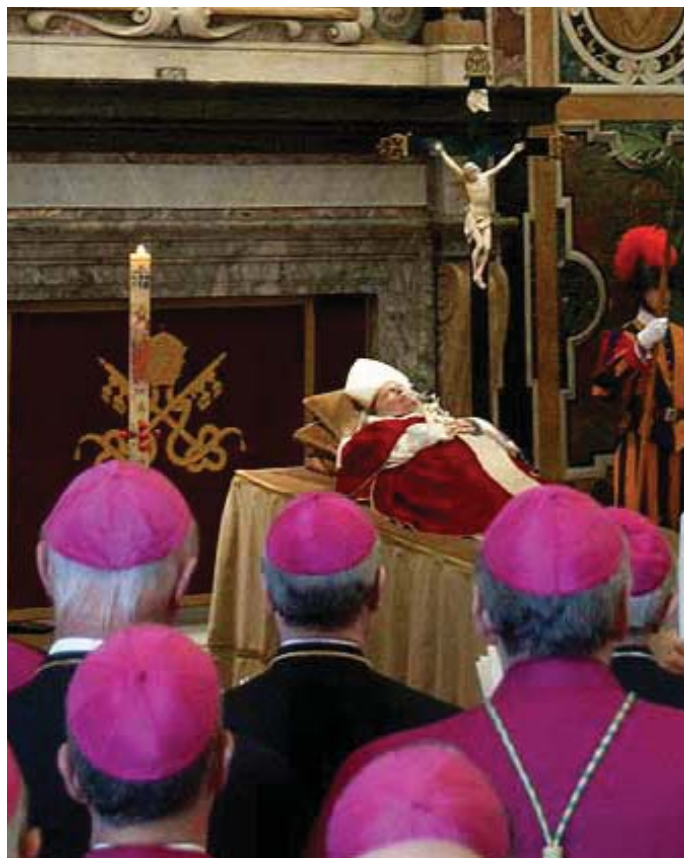
Capilla ardiente del Papa Juan Pablo II.