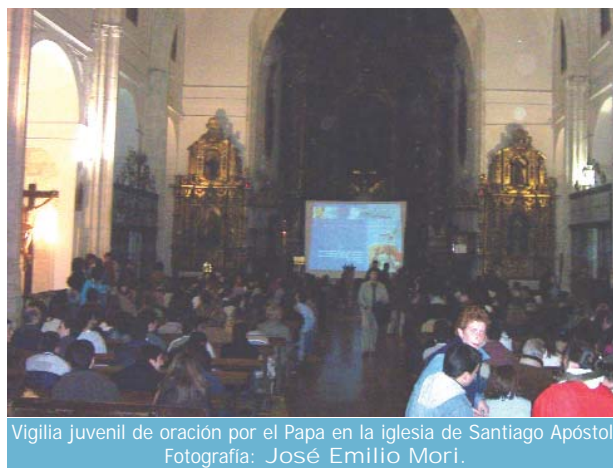
Vigilia juvenil de oración por el Papa en la iglesia de Santiago Apóstol.

La Archidiócesis, previendo esta masiva afluencia de ciudadanos, instaló una pantalla gigante en la plaza de la Universidad y dos más en el interior de la catedral para facilitar la participación en la Eucaristía. En el momento de la Comunión, el vicario general, Félix López Zarzuelo, y varios sacerdotes salieron a la calle para impartir el Sacramento.