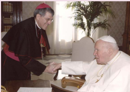
Juan Pablo II recibe al arzobispo de Valladolid en la última "Visita ad limina" del pasado mes de enero

Donde mejor se expresa esa unidad y comunión del Santo Padre y los