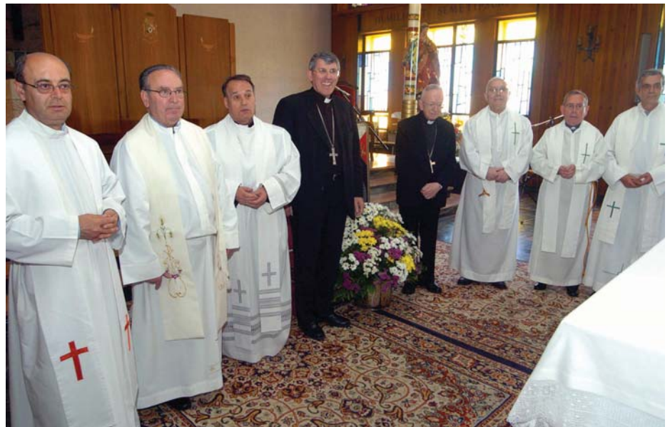
El arzobispo de Valladolid con el arzobispo emérito y algunos de los sacerdotes homenajeados.