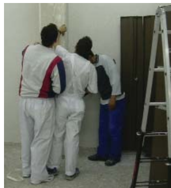
Cáritas trabaja en programas de integración laboral.

Una experiencia significativa ha sido el Foro