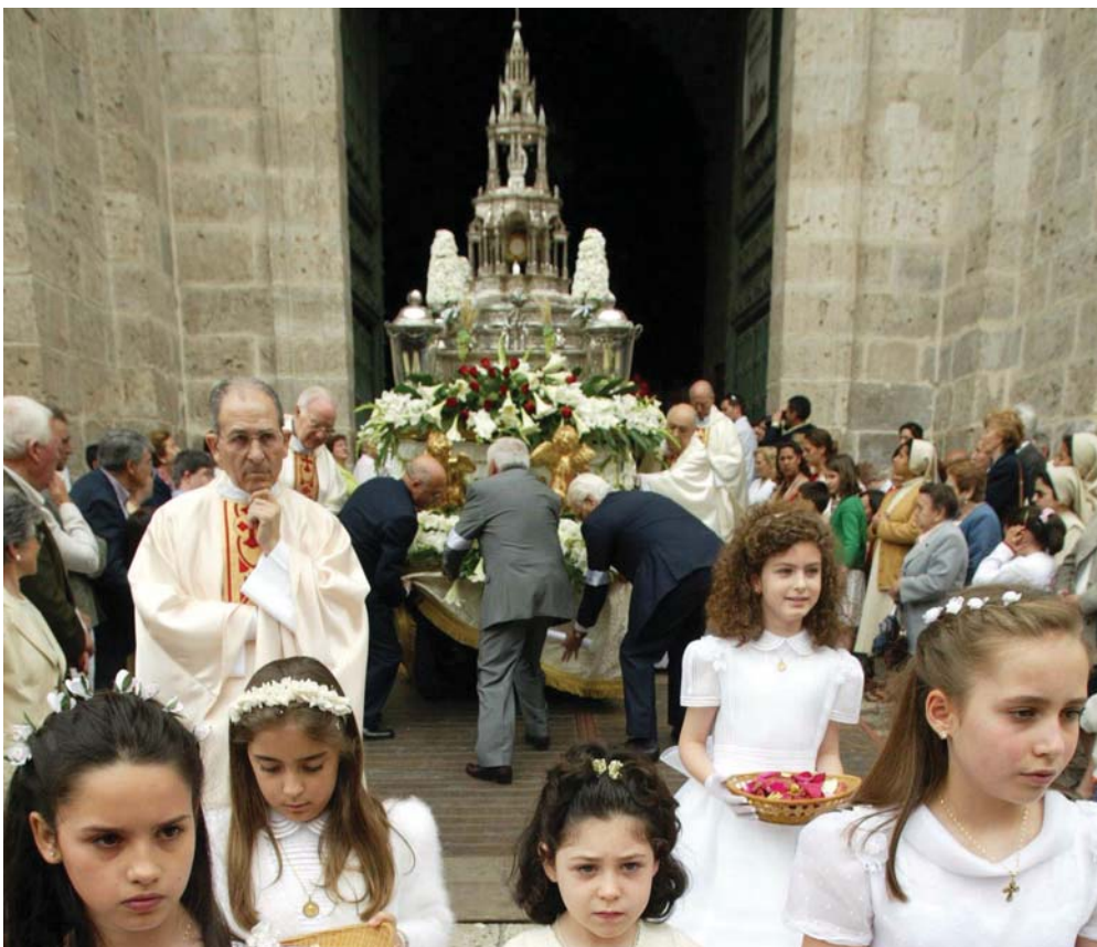
El Santísimo Sacramento del Altar sale de la catedral para comenzar la procesión del Corpus Christi.

Un año más, los ciudadanos afrontamos la obligación de efectuar nuestra declaración de la Renta y, un año más, tenemos la ocasión, y el deber moral, de destinar un 0,52 por ciento de lo declarado a la Iglesia católica. No se trata de pagar más, sino de destinar mejor lo que pagamos. La Iglesia, de la que todos formamos parte, lleva dos mil años haciendo el bien y tiene que seguir haciéndolo. Poniendo la "cruz" en la casilla de la Iglesia, que no es incompatible con la de "otros fines sociales", tendremos la plena seguridad de que nuestro dinero se destinará a un buen fin. Si no lo hace la Iglesia, si no lo hacemos los católicos, ¿quien lo hará por nosotros? ( Más información en pág. 5 ).