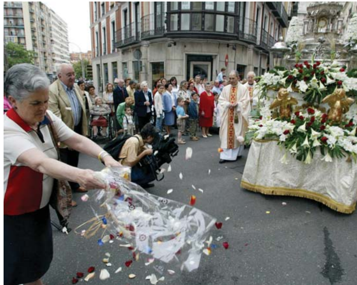
Los fieles "sembraron" de flores el recorrido de la Custodia por Valladolid.

Tras la Misa, el Santísimo salió a la calle a los acordes del Himno Nacional y entre cánticos de alabanza acompañado por mayores y niños, estos últimos ataviados con los trajes de la Primera Comunión que acababan de recibir y a los que el arzobispo recordó que recibir el