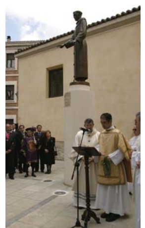
Inauguración de la estatua del patrón, en 2004.

cinco mil personas, y, el viernes 3 de junio, la procesión del Corazón de Jesús, entre la catedral y el santuario, dentro de los actos conmemorativos de la Semana del Corazón de Jesús, que inauguró el día 29 el arzobispo emérito, José Delicado Baeza ■