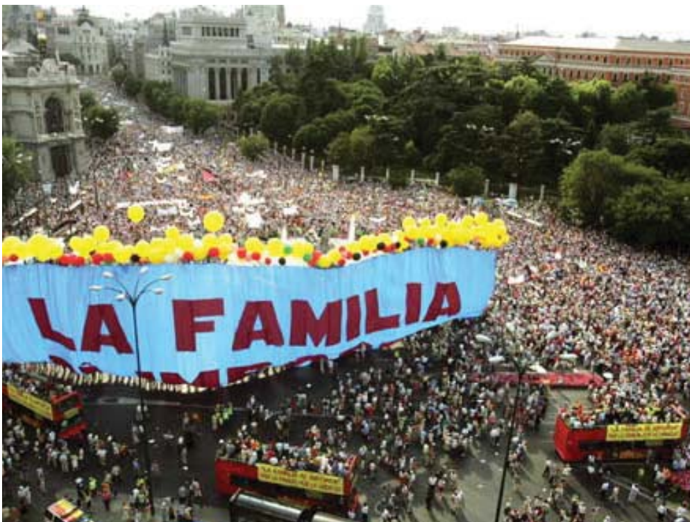
Una gran pancarta y ambiente festivo presidieron la manifestación en defensa de la familia.