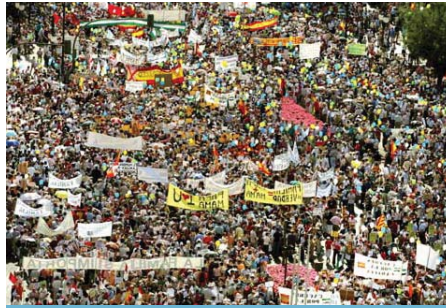
Las grandes avenidas se quedaron pequeñas.