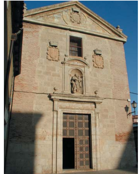
El Carmelo de San José de Medina de Rioseco.

El Arzobispado trabaja en la elaboración de