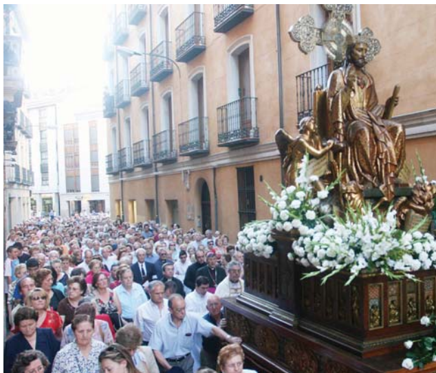
Los fieles abarrotaron las calles céntricas de la ciudad.

Durante el recorrido, los devotos, que escoltaban las imágenes de Cristo Rey y del Inmaculado Corazón de María, entonaron cánticos de alabanza al Sacratísimo Corazón y en recuerdo del jesuita vallisoletano Bernardo de Hoyos, artífice de la extensión de la devoción en España y, muy par-