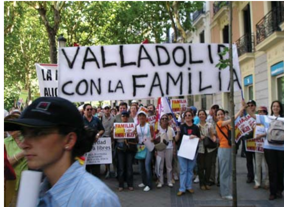
Un grupo de vallisoletanos en la reivindicación del 18 de junio.

Una avalancha tranquila y festiva va anegando la Puerta de Alcalá desde todas las bocacalles hacia Cibeles. Cuando estamos llegando a la plaza cortan por fin el tráfico: la calle es nuestra. Buscamos referencia de nuestra familia, perdemos la de la pancarta. Hay muchas, una dice: "somos socialistas, por eso estamos a favor de la familia". Una riada fluye desde el Paseo del Prado. Nos hemos encontrado en la puerta del Banco de España. La abuela con nuestra hija mayor está en la Puerta del Sol; ella se quedará allí, se ha llevado una silla plegable