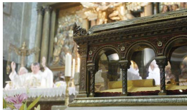
La urna con las reliquias de la Santa en la "Gran Promesa".