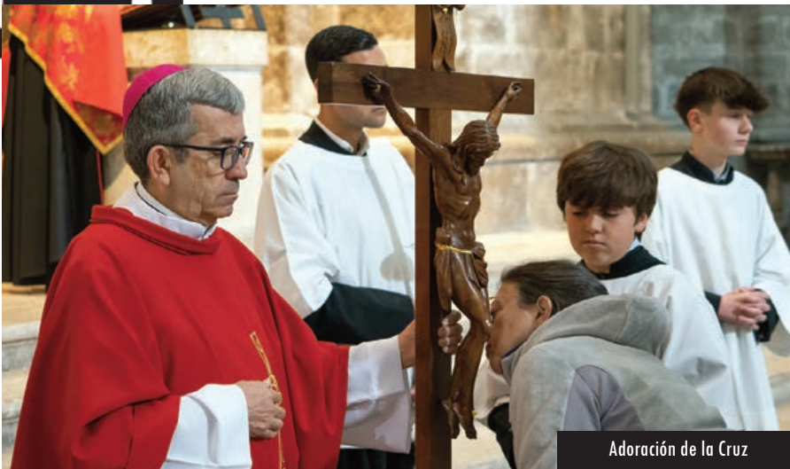
Adoración de la Cruz