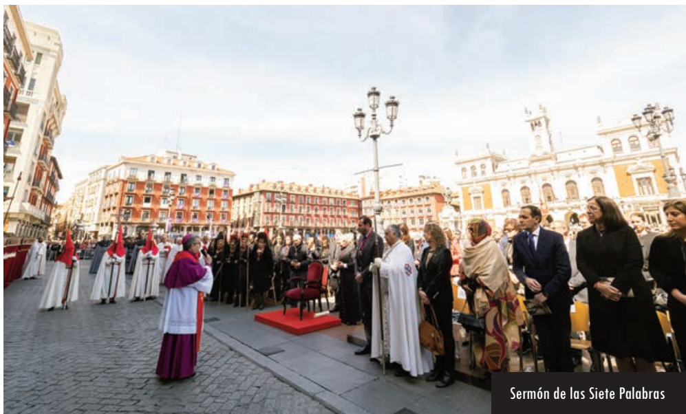
Sermón de las Siete Palabras

Nuestro arzobispo reprobaba las “propuestas asfixiantes que quieren regular todos los aspectos de la vida y la conciencia”