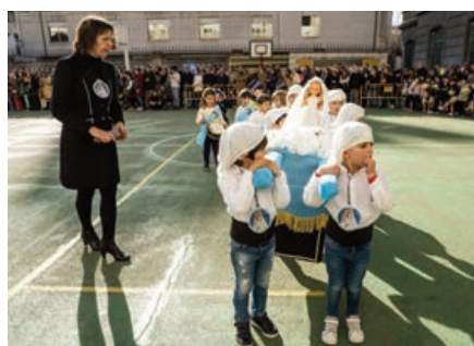
Nuestra Señora de Lourdes