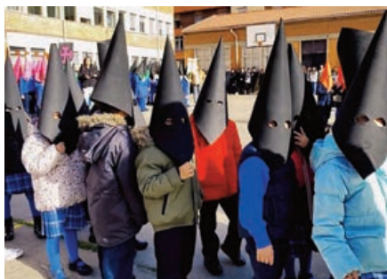
Nuestra Señora del Carmen