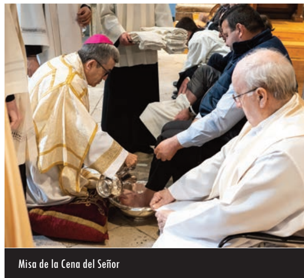
Misa de la Cena del Señor