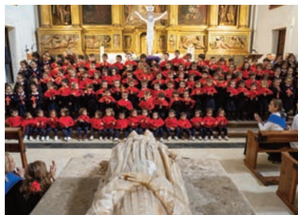
Santa M a la Real de Huelgas