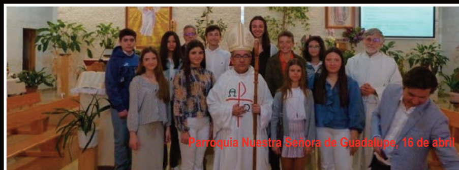
Parroquia Nuestra Señora de Guadalupe, 16 de abril