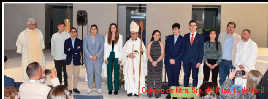
Colegio de Ntra. Sra. del Pilar, 15 de abril