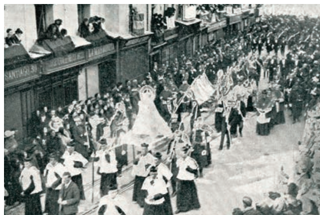
La Virgen de San Lorenzo ya coronada, camino de la parroquia

amaneció el gran día, 21 de octubre, con un repique general de campanas, calles adornadas y colgaduras en los balcones. Después del ligero retraso del infante Fernando en su viaje en el tren correo, se subió al púlpito catedralicio el entonces obispo de Segovia, Remigio Gandásegui. Permaneció predicando por espacio de una hora. A la conclusión de la mencionada Misa solemne, se hizo presente el anciano cardenal. Una vez que fue bajada del