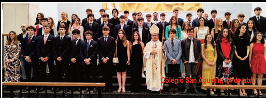
Colegio San Agustín, 14 de abril