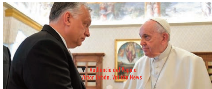
Audiencia del Papa a Viktor Orbán.

Viaje, pues, interesante y lleno de incógnitas pero que la sagacidad del Papa intentará resolver.