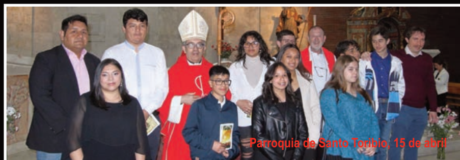
Parroquia de Santo Toribio, 15 de abril