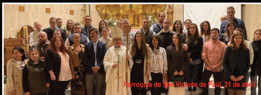
Parroquia de San Vicente de Paúl, 21 de abril