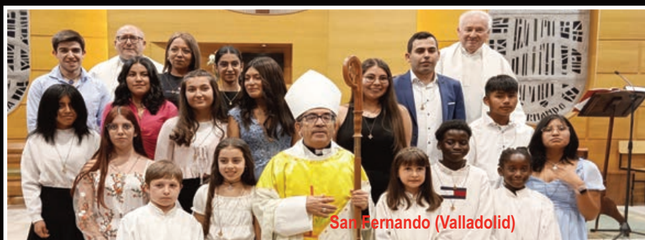
San Fernando (Valladolid)