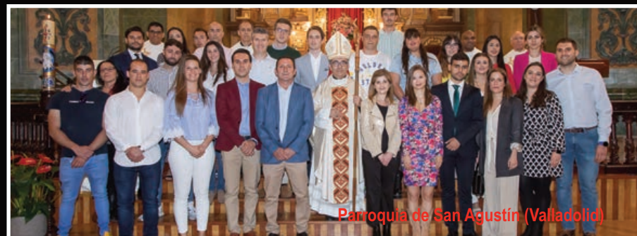
Parroquia de San Agustín (Valladolid)