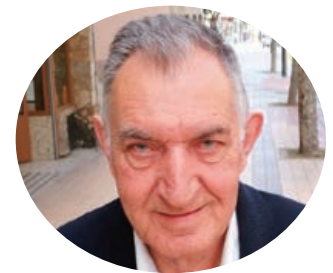
Hipólito Tabera ▲