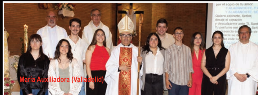
María Auxiliadora (Valladolid)