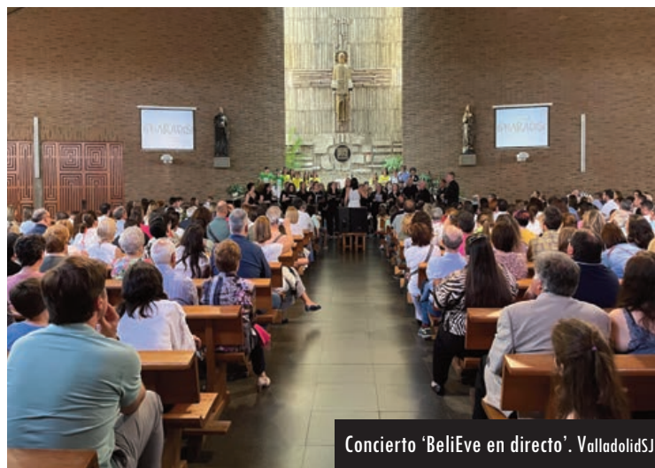
Concierto 'BeliEve en directo'. ValladolidSJ