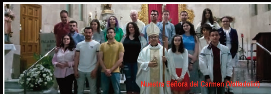
Nuestra Señora del Carmen (Valladolid)