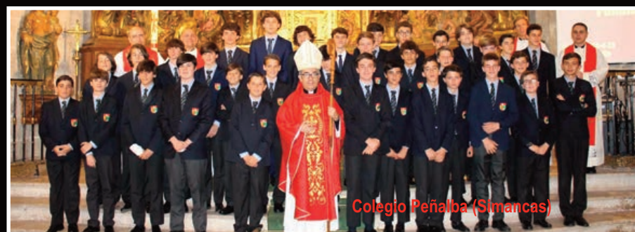
Colegio Peñalba (Simancas)