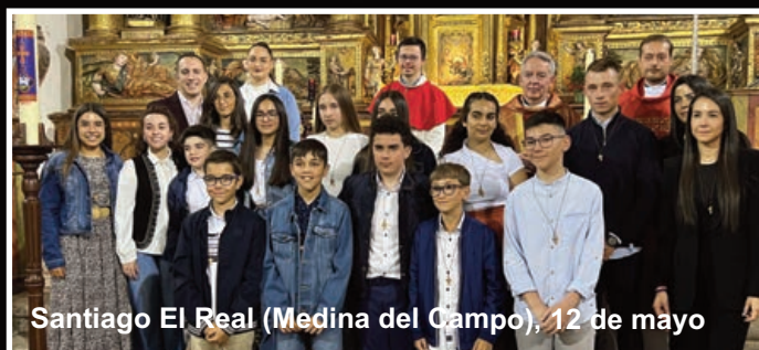
Santiago El Real (Medina del Campo), 12 de mayo