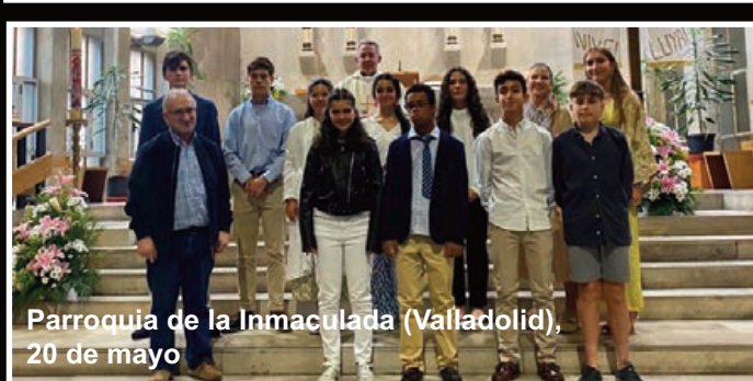
Parroquia de la Inmaculada (Valladolid), 20 de mayo