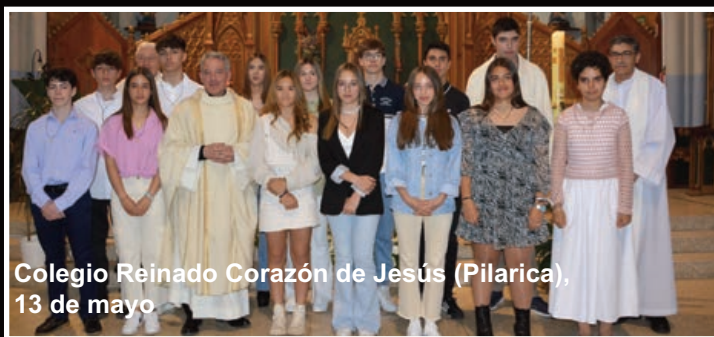
Colegio Reinado Corazón de Jesús (Pilarica), 13 de mayo