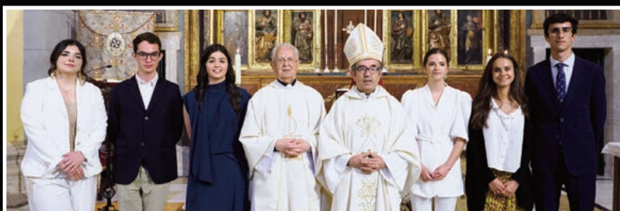
Un grupo de adultos de Pastoral Universitaria recibió el sacramento en la iglesia de Las Angustias de Valladolid, el pasado 20 de mayo.