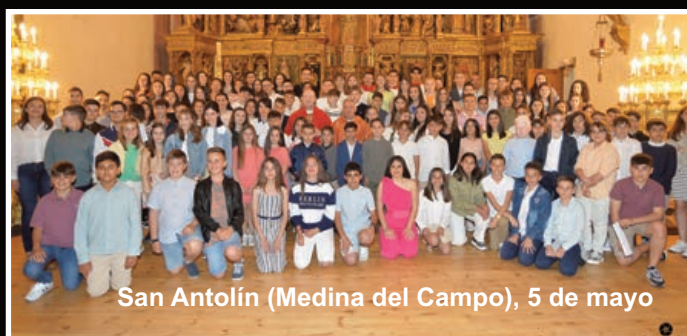
San Antolín (Medina del Campo), 5 de mayo