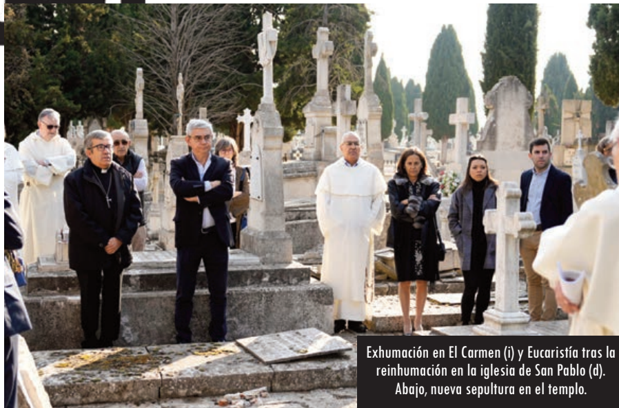
Exhumación en El Carmen (j) y Eucaristía tras la reinhumación en la iglesia de San Pablo (d). Abajo, nueva sepultura en el templo.