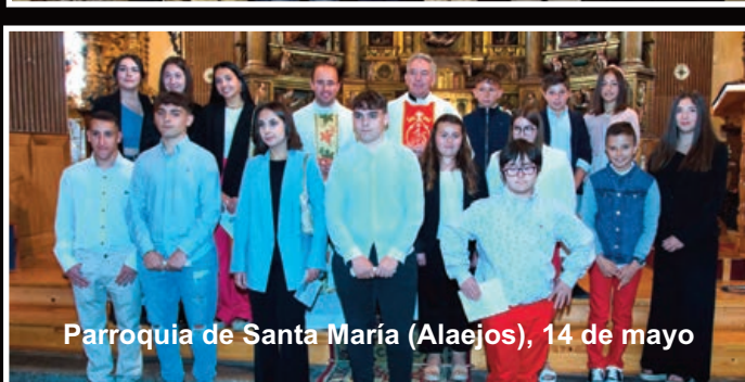
Parroquia de Santa María (Alaejos), 14 de mayo