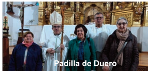
Padilla de Duero