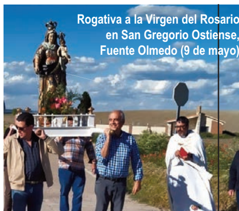
Rogativa a la Virgen del Rosario en San Gregorio Ostiense, Fuente Olmedo (9 de mayo)