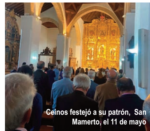
Ceinos festejó a su patrón, San Mamerto, el 11 de mayo