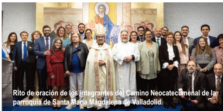
Rito de oración de los integrantes del Camino Neocatecumenal de la parroquia de Santa María Magdalena de Valladolid.

Ofrece servicios de acompañamiento espiritual, jurídico, psicológico o médico y también un servicio de mediación familiar canónica: un proceso voluntario, confidencial e imparcial, en el que a través de un mediador acreditado, las personas involucradas intentan llegar a acuerdos para solucionar su conflicto.