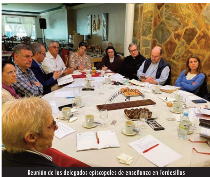
Reunión de los delegados episcopales de enseñanza en Tordesillas