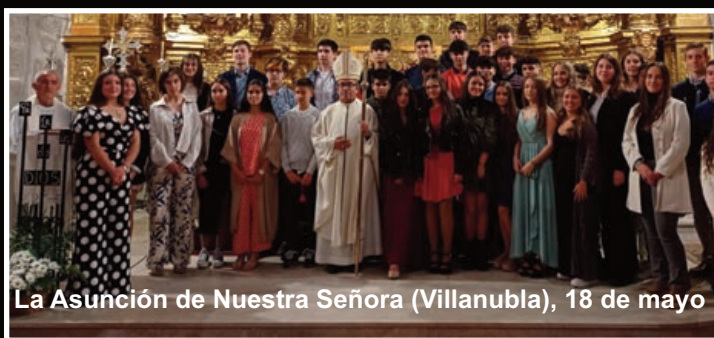
La Asunción de Nuestra Señora (Villanubla), 18 de mayo