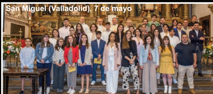
San Miguel (Valladolid), 7 de mayo