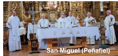
San Miguel (Peñafiel)