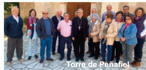
Torre de Peñafiel