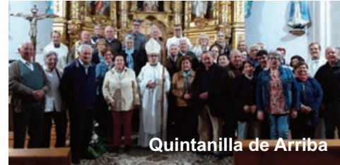
Quintanilla de Arriba