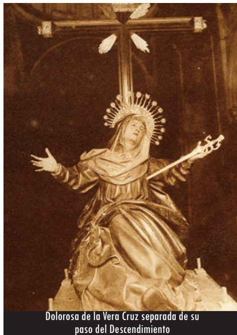
Dolorosa de la Vera Cruz separada de su paso del Descendimiento

Aquella talla mariana, secundaria para el conjunto pero de una gran calidad, adquirió una extraordinaria devoción en la cofradía a lo