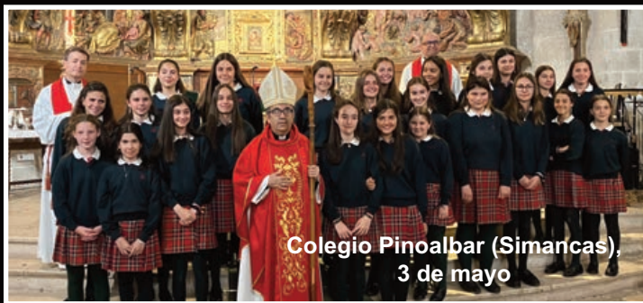
Colegio Pinoalbar (Simancas), 3 de mayo