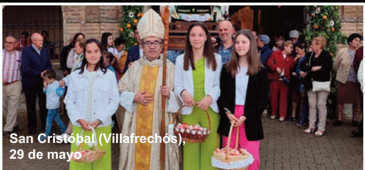
San Cristóbal (Villafrechós), 29 de mayo