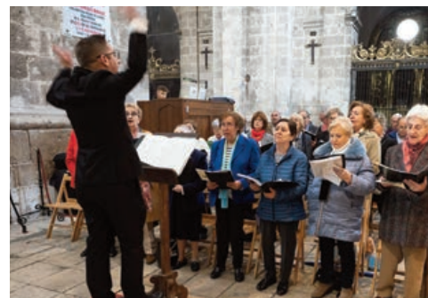
El Coro Diocesano, en Pentecostés

Renovada esa efusión del Espíritu Santo, es importante discernir juntos caminos de misión genuinamente laicales, por ello, invitó especialmente a los laicos asociados a asistir en el Centro de Espiritualidad en la presentación y propuesta de trabajo que nos ofrece la Iglesia española en el instrumento de trabajo pastoral 'El Dios fiel mantiene su alianza'