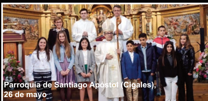
Parroquia de Santiago Apóstol (Cigales), 26 de mayo