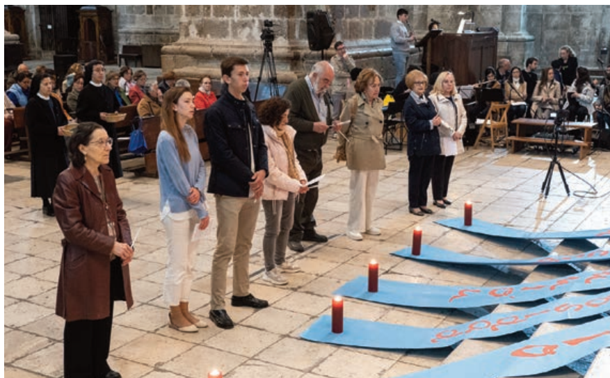
Vigilia de Pentecostés en la catedral de Valladolid.