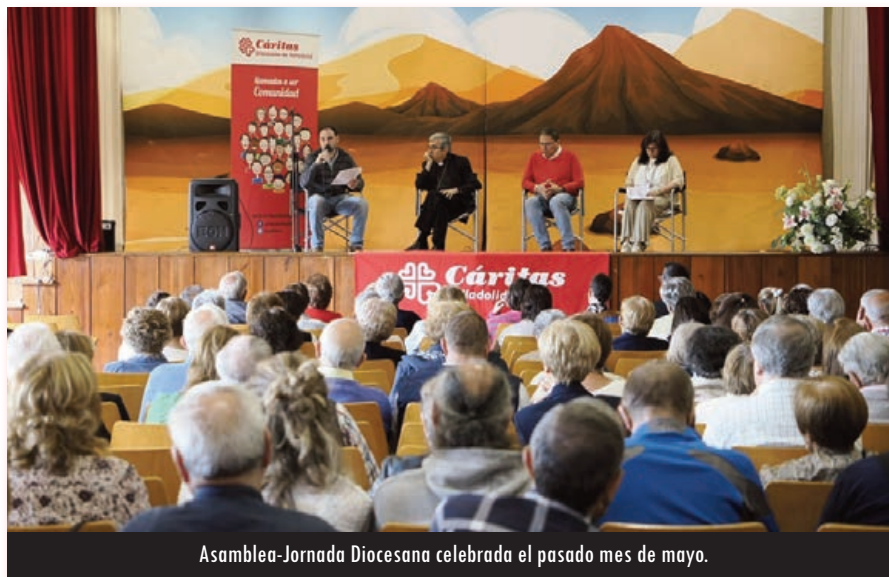
Asamblea-Jornada Diocesana celebrada el pasado mes de mayo.