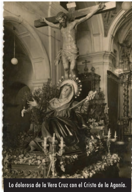
Lo dolorosa de la Vera Cruz con el Cristo de la Agonía.

confirmación si la controversia llegó a pleito entre ambas partes. La cofradía encargó esa copia a un escultor que no igualaba la genialidad del maestro Fernández, Pedro León Sedano. Debió de ser, además, una obra de juventud de este último, académico en aquel siglo en que se creó la de Matemáticas y Nobles Artes –hoy llamada de Bellas Artes de la Purísima Concepción–, pues había nacido en 1736 y falleció en 1809.