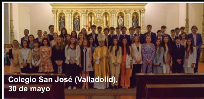
Colegio San José (Valladolid), 30 de mayo