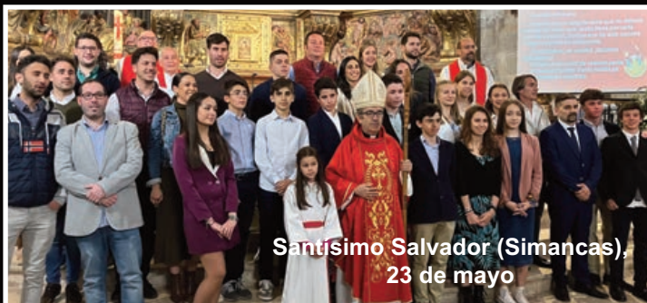
Santísimo Salvador (Simancas), 23 de mayo