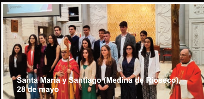
Santa María y Santiago (Medina de Rioseco), 28 de mayo