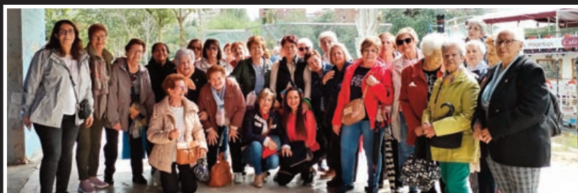
Una tarde de Convivencia

La valoración de esta actividad común del programa resultó tan positiva que ya surgieron nuevas propuestas para el próximo curso. ' Envejecemos en común ' está subvencionado por la Junta, con cargo a la asignación tributaria del IRPF.