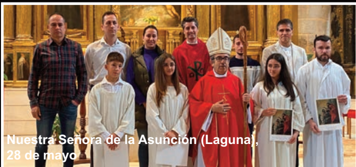
Nuestra Señora de la Asunción (Laguna), 28 de mayo