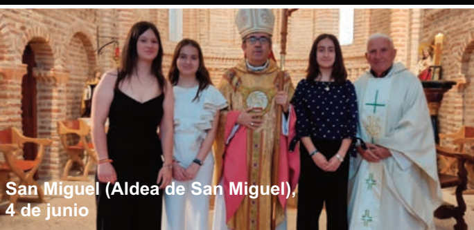
San Miguel (Aldea de San Miguel), 4 de junio