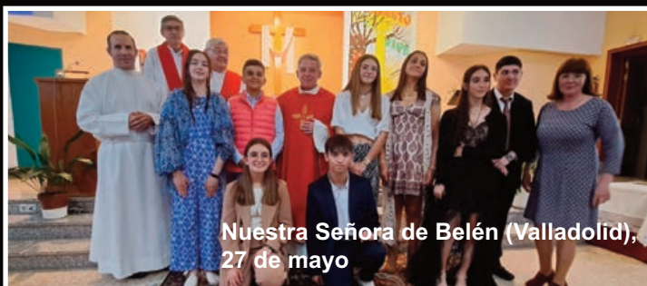
Nuestra Señora de Belén (Valladolid), 27 de mayo