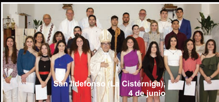
San Ildefonso (La Cistérniga), 4 de junio