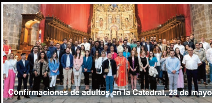
Confirmaciones de adultos en la Catedral, 28 de mayo