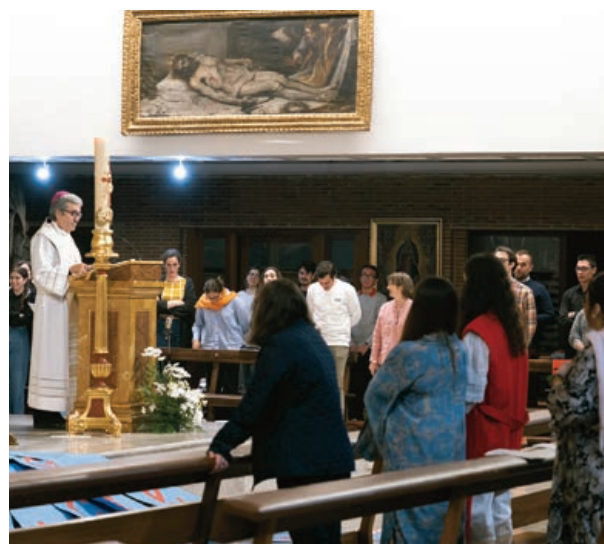
Vigilia 'joven' de Pentecostés en la parroquia de San Lorenzo