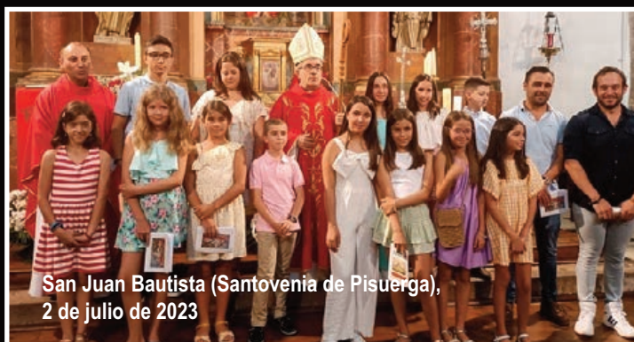
San Juan Bautista (Santovenia de Pisuerga), 2 de julio de 2023