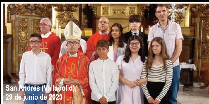
San Andrés (Valladolid), 29 de junio de 2023