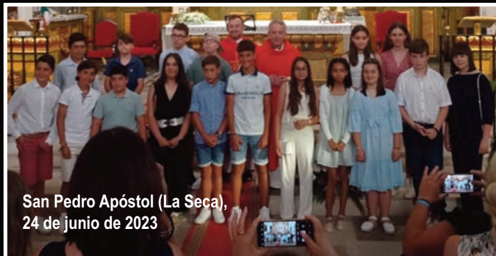
San Pedro Apóstol (La Seca), 24 de junio de 2023