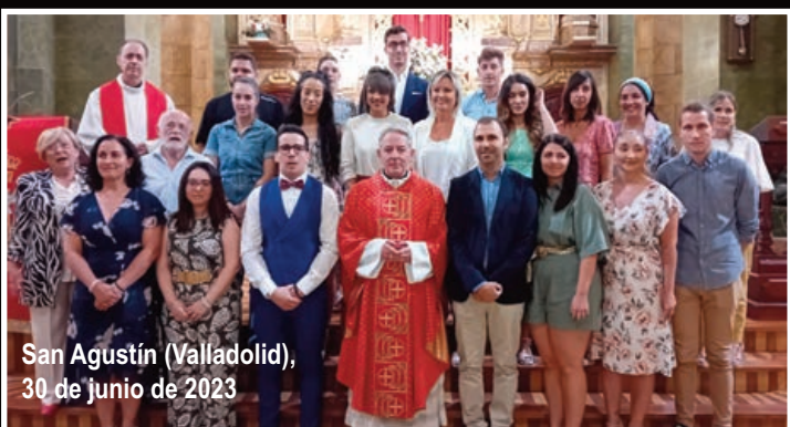
San Agustín (Valladolid), 30 de junio de 2023