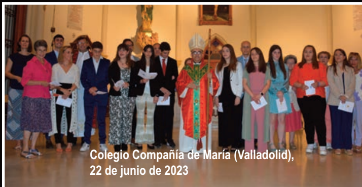
Colegio Compañía de María (Valladolid), 22 de junio de 2023