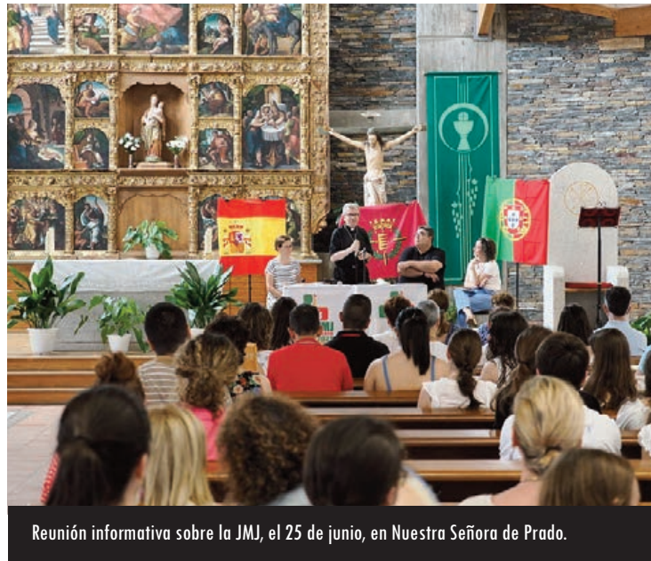
Reunión informativa sobre la JMJ, el 25 de junio, en Nuestra Señora de Prado.

Que María, Virgen de Fátima, interceda por nosotros para que la Jornada Mundial de la Juventud de Lisboa sea un auténtico acontecimiento del Espíritu para todos nosotros.