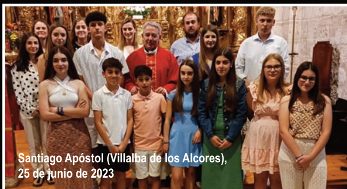
Santiago Apóstol (Villalba de los Alcores), 25 de junio de 2023