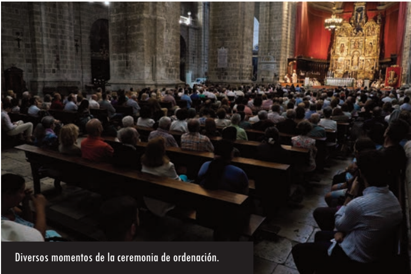
Diversos momentos de la ceremonia de ordenación.