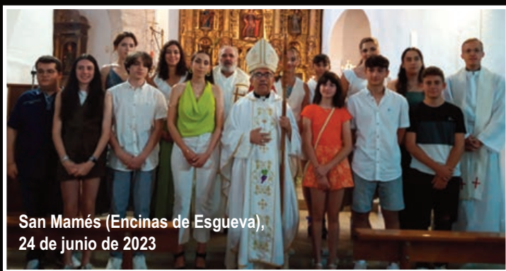
San Mamés (Encinas de Esgueva), 24 de junio de 2023