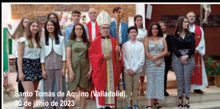
Santo Tomás de Aquino (Valladolid), 30 de junio de 2023