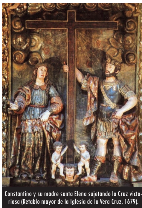
Constantino y su madre santa Elena sujetando la Cruz victoriosa (Retablo mayor de la Iglesia de la Vera Cruz, 1679).

que podemos contemplar en el primer lienzo donde apareció, el realizado por Felipe Gil de Mena para plasmar las fiestas de la Cruz de mayo de 1656. El barroco fue añadiendo otros elementos como los campanarios. Se constituía como un arco de triunfo, inspirado en el modelo romano aunque dentro del estilo clasicista vallisoletano. Pronto, la iglesia empezó a ser desmantelada para ser ampliada. Para entonces, ya contaba con las obras procesionales de Gregorio Fernández y Andrés de Solanes.