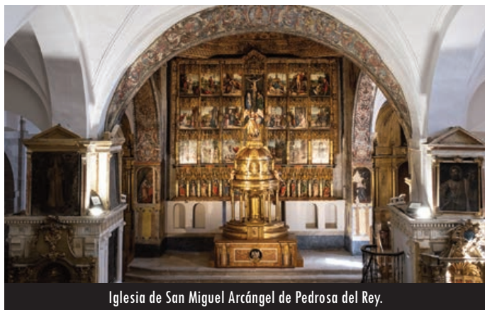
Iglesia de San Miguel Arcángel de Pedrosa del Rey.

Lo que viene a ser llamado "vuelta a la realidad", que podría ser como el tiempo de la mistagogía en el recorrido catecumenal, o la llamada quinta semana de los Ejercicios Espirituales. Evidentemente, el final de esta etapa habrá de provocar en los jóvenes lo que el Papa Francisco les pide: "hagan lío en las diócesis". Cuando tienes dentro una gran alegría esto mueve a la comunicación: que sea la Palabra la que ponga en nuestra boca la misma Palabra, incluso a través de los hechos. La experiencia habrá de ser expresada y dicha; pues las expresiones responden a la experiencia humana y divina de Jesucristo que es la Palabra de Dios hecha carne. Así pues, la Palabra de Dios encontrará eco en la vida de estos muchachos y animará a la difusión o testimonio.