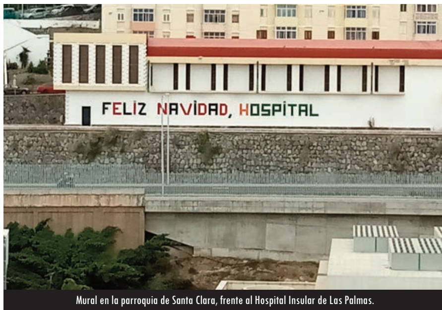
Mural en la parroquia de Santa Clara, frente al Hospital Insular de Las Palmas.

Un matrimonio que celebra sus 55 años de matrimonio en el hospital, él