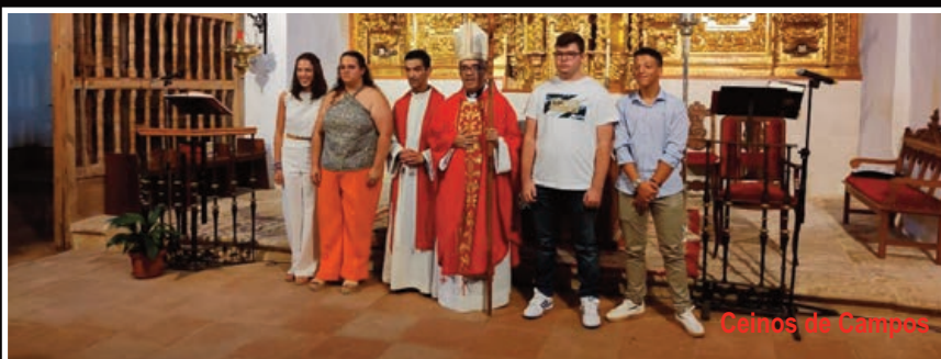
Ceinos de Campos

lladolid, don Luis Argüello, administró el mismo sacramento a una docena de jóvenes en Cogeces del Monte. 19 de agosto de 2023: Las últimas confirmaciones del curso tuvieron lugar en Ceinos de Campos y fueron administradas por nuestro arzobispo a cuatro jóvenes en la parroquia de Santiago.