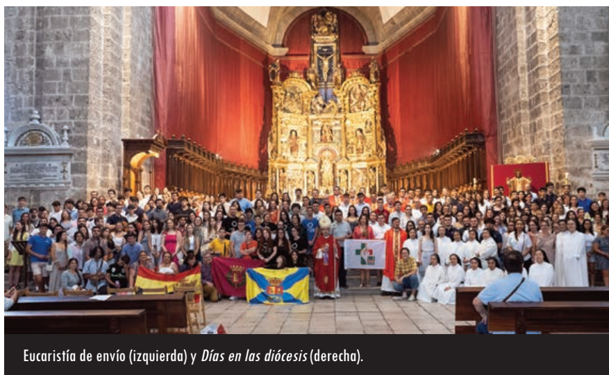
Eucaristía de envío (izquierda) y Días en las diócesis (derecha).