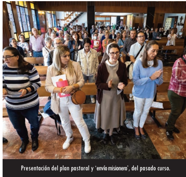
Presentación del plan pastoral y 'envío misionero', del pasado curso.

Los presbíteros , agradados por un don sacramental de radical forma comunitaria, tenéis la encomienda de ser cauce de la gracia y ministros de la reconciliación y la comunión. Hemos de discernir juntos, también con el pueblo de Dios, cómo ser fieles al sacerdocio apostólico en la novedad de este momento . Es tiempo de unirnos en el Corazón de Cristo y de ofrecer un testimonio visible de comunión y entrega al servicio de la comunión y misión de toda la Iglesia que peregrina en Valladolid.