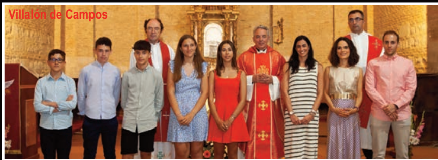
Villalón de Campos