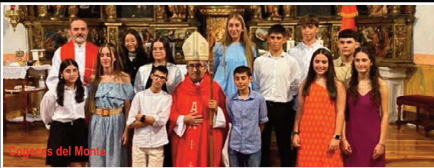
Cogeces del Monte