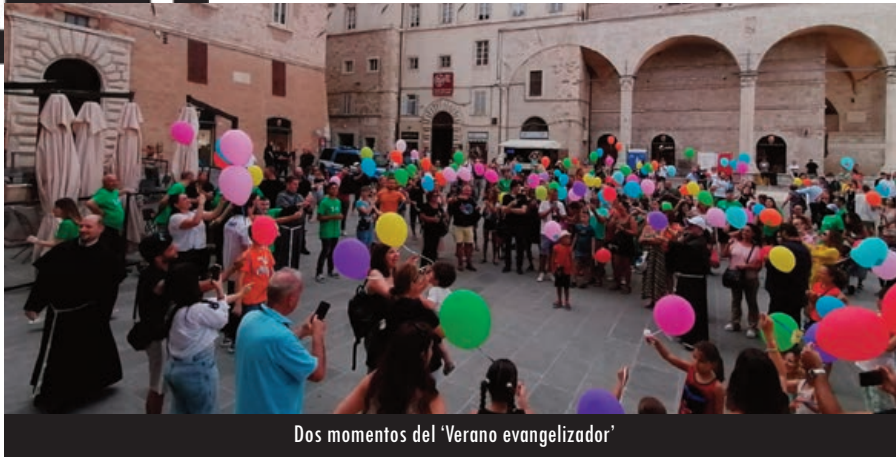
Dos momentos del 'Verano evangelizador'