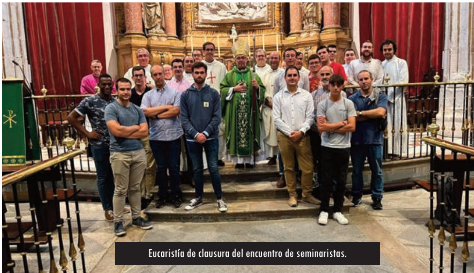
Eucaristía de clausura del encuentro de seminaristas.