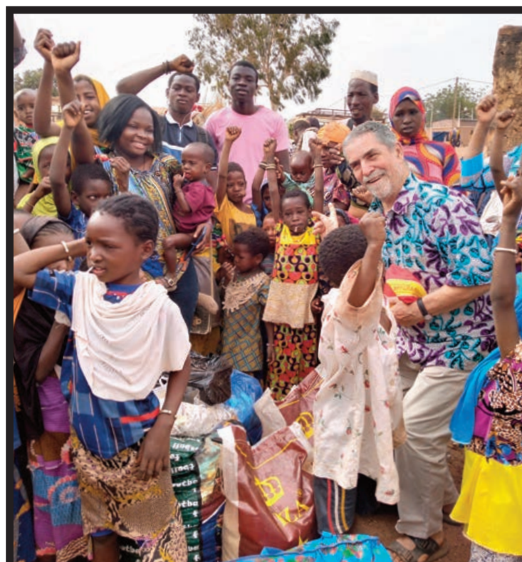
Refugiados 'peulhs' (pastores) en Kudugu, Burkina Faso, donde reside el misionero.

Y en 2015 empezó la guerra de los terroristas islámicos. Estaba yo en Arbinda, una localidad del Sahel, donde las calles son de arena, uno se hunde, no se puede andar bien y menos transitar en moto. Y donde los musulmanes son numerosos, pero amigos nuestros. Sin embargo los ataques