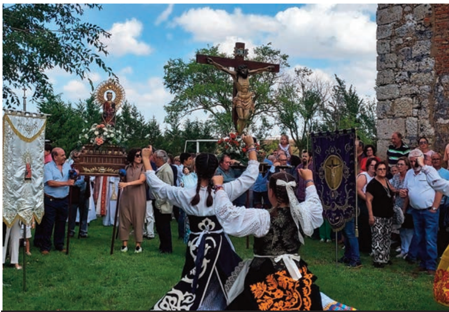
Celebración de la Virgen de Castilviejo, en Rioseco, (imagen superior) y de la del Villar, en Laguna, (inferior).

Como suele pasar en muchas fiestas litúrgicas su origen lo encontramos en el oriente cristiano hasta que un papa lo instituye en occidente como fue el caso de esta fiesta mariana con el papa Sergio I, sucesor de san Pedro número 84 entre los años 681 y 701. Es interesante observar que en el calendario litúrgico solamente celebramos tres nacimientos: el de Nuestro Señor Jesucristo, el 25 de diciembre, el de la virgen María el 8 de septiembre y el de san Juan Bautista, el 24 de junio.