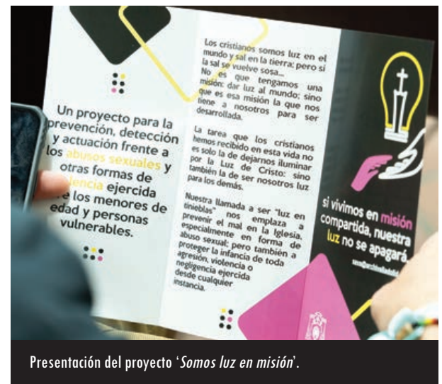
Presentación del proyecto 'Somos luz en misión'.