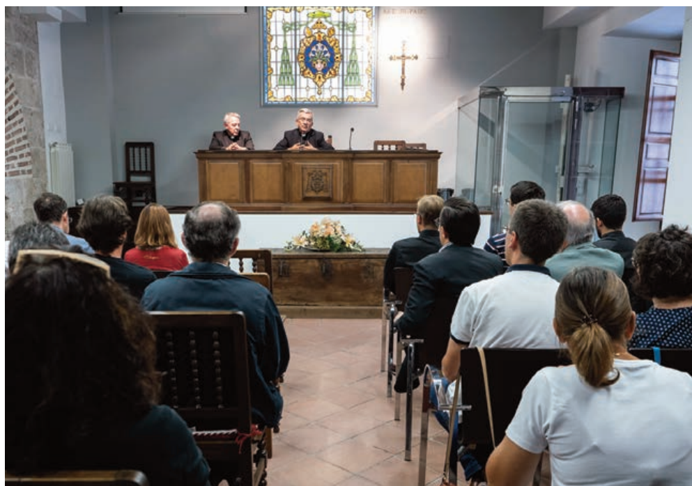
Constitución de los primeros equipos de trabajo de las delegaciones diocesanas, el 4 de septiembre.

El Sínodo va a celebrar una primera sesión en este encuentro con más de trescientos participantes, entre obispos, presbíteros, laicos y consagrados. Seguramente, la propia asamblea sinodal nos proponga alguna tarea para desarrollar los meses siguientes, con el propósito de seguir profundizando en el diálogo, en el discernimiento y en la propuesta. De esta manera, en octubre de 2024, la segunda sesión del Sínodo podrá ofrecer al papa Francisco las sugerencias, las inquietudes y las proposiciones para que la Iglesia, que es misterio, comunión y misión, pueda ser signo e instrumento en medio de nuestro mundo de la comunión de Dios y el anuncio misionero de su salvación.