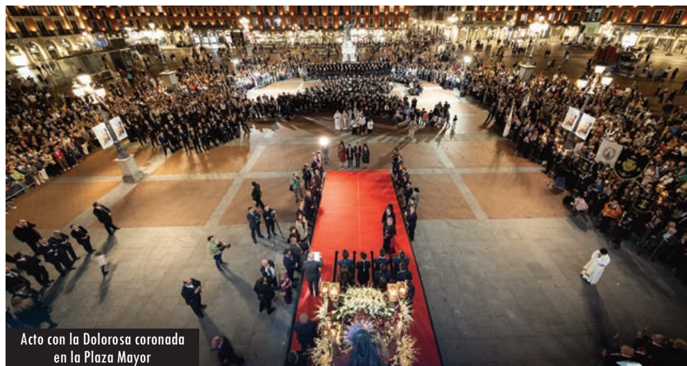
Acto con la Dolorosa coronada en la Plaza Mayor

El 23 todo habría de comenzar con una Catedral repleta de fieles, cofrades, instituciones de la ciudad, autoridades. Hacía mucho que la Iglesia mayor y metropolitana no se contemplaba con este aspecto. La homilía del arzobispo Luis Argüello, con la presencia del cardenal Blázquez, fue el momento previo al gran momento. Distinguió dos formas de pre-