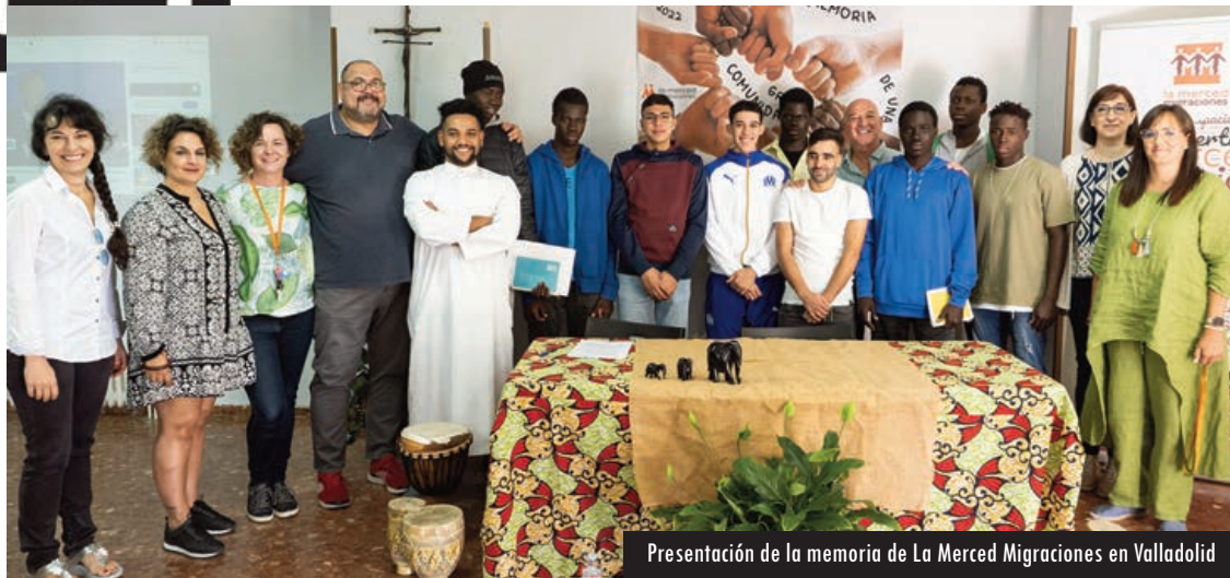
Presentación de la memoria de La Merced Migraciones en Valladolid

con puertas que se cierran, pero también se le abrirán ventanas y manos amigas que se extienden para recibirles e integrarles. De esas puertas y ventanas abiertas tiene la suerte de ser testigo y participe La Merced, testigo de personas que abren la posibilidad de encuentros auténticos.