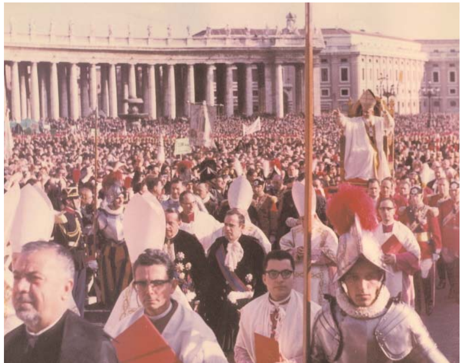
Imagen de la procesión de clausura del Concilio Vaticano II, en la Plaza de San Pedro

to los consejos presbiteral y de pastoral; que, sin embargo, tendrán una vida bastante lánguida, carentes del espíritu de colegialidad y corresponsabilidad auspiciado en el Concilio.