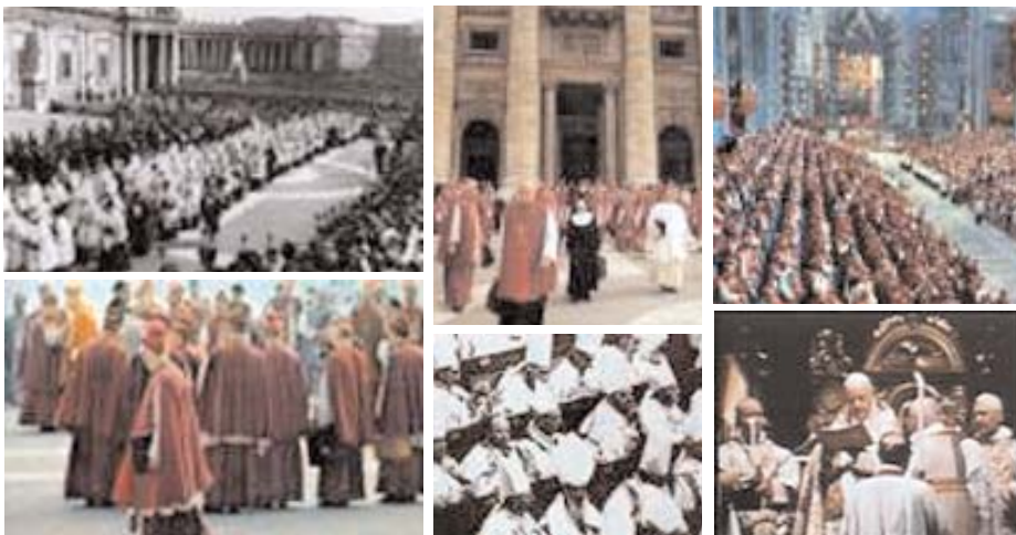
Distintas imágenes del Concilio Vaticano II

La lectura de los documentos conciliares sigue teniendo una enorme actualidad en el mundo de hoy y en nuestra Iglesia como confirma la Gaudium et Spes