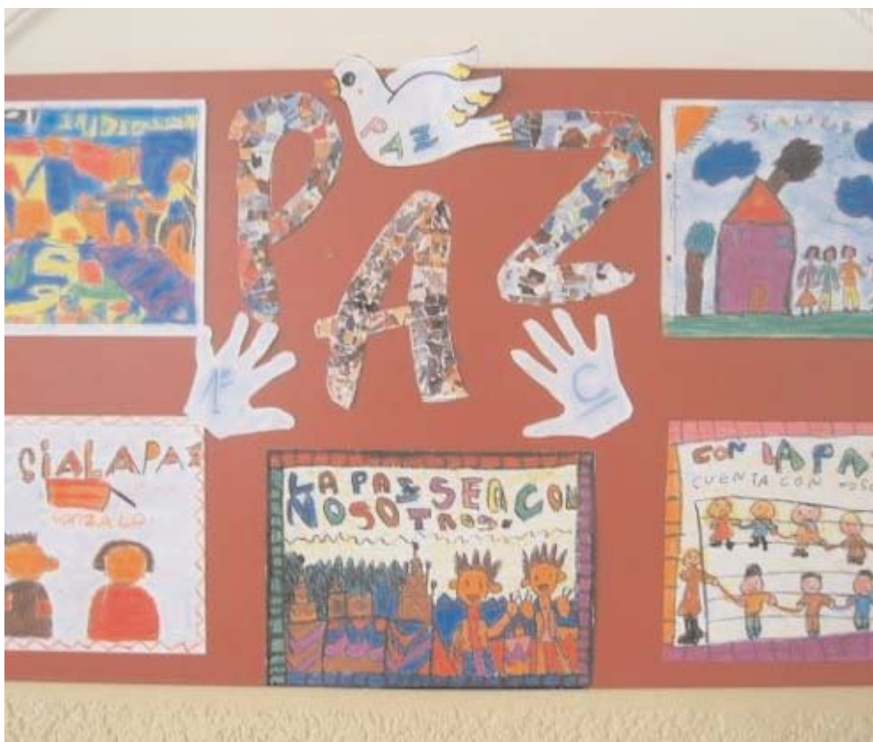
Dibujo sobre la Paz de alumnos de Infantil del Colegio San Agustín de Valladolid.