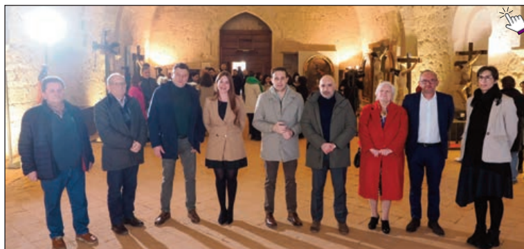
El delegado de Patrimonio de la Archidiócesis y el presidente de la Diputación, entre otros

El refectorio del Monasterio de Santa María de Valbuena, en San Bernardo, donde tiene su sede la Fundación Las Edades del Hombre, fue testigo el pasado 12 de marzo de la presentación en sociedad de las seis obras restauradas por la Fundación a lo largo del año 2024, gracias al convenio que desde hace 22 ediciones mantiene con la Diputación Provincial de Valladolid.