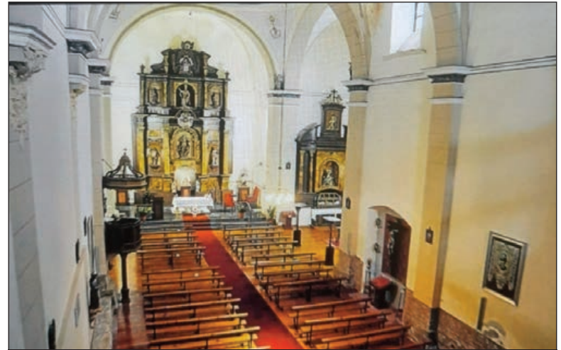
Interior de la Iglesia Parroquial de la Asunción

En la Iglesia de San Miguel se encuentra la imagen del muy venerado 'Cristo de las Aguas'; el cual, cuenta con muchos devotos. Por su parte, en el lado de la Epístola, se puede admirar una excelente escultura de la In-