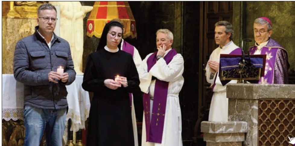
La Basílica—Santuario Nacional de la Gran Promesa acogió el pasado 21 de marzo, tercer viernes de Cuaresma, una celebración penitencial jubilar con motivo del Año Santo, ‘Peregrinos de Esperanza’

E l Santuario Nacional de La Gran Promesa fue inaugurado en el año 1941 y el 12 de mayo de 1964 el Papa Pablo VI concedió al templo el título de Basílica menor. El Centro Diocesano de Espiritualidad (CDE) se constituyó el 28 de septiembre de 1994 como un lugar de acogida, descanso, oración y formación, donde encontrarse con Dios, con uno mismo, con los demás. Ambos son lugares de paz en el corazón de Valladolid.