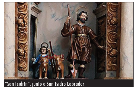
"San Isidrn", junto a San Isidro Labrador

Debido, principalmente, a la despoblación y al igual que en otros muchos municipios de la provincia de Valladolid, otras tradiciones se perdieron —varias de ellas, con un sentido religioso—. Es el caso de la conocida como "Virgen de los Pastores", que se celebraba hacia el 8 de septiembre. Esta misma Virgen salía el día de San Marcos, el 25 de abril, y el Domingo de Resurrección.