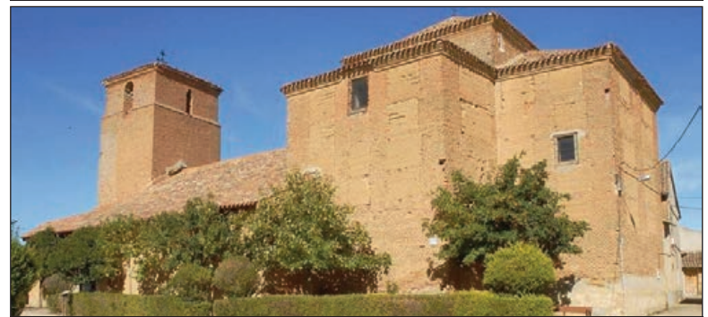
Iglesia de San Miguel

maculada Concepción del siglo XVIII; al igual que un retablo salomónico del siglo XVII con una fina policromía.