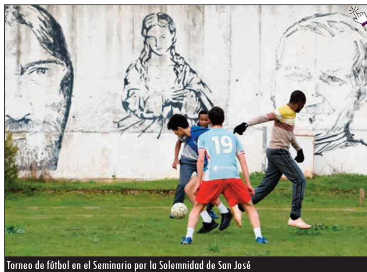
Torneo de fútbol en el Seminario por la Solemnidad de San José