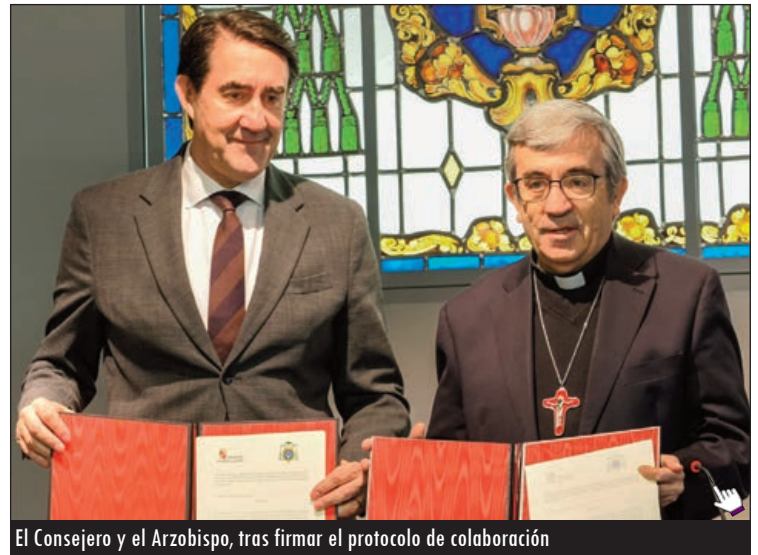
El Consejero y el Arzobispo, tras firmar el protocolo de colaboración

La firma de este protocolo supone, además, un nuevo ejercicio de