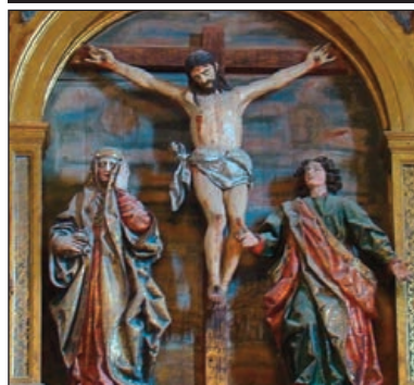
Calvario del retablo de la Iglesia