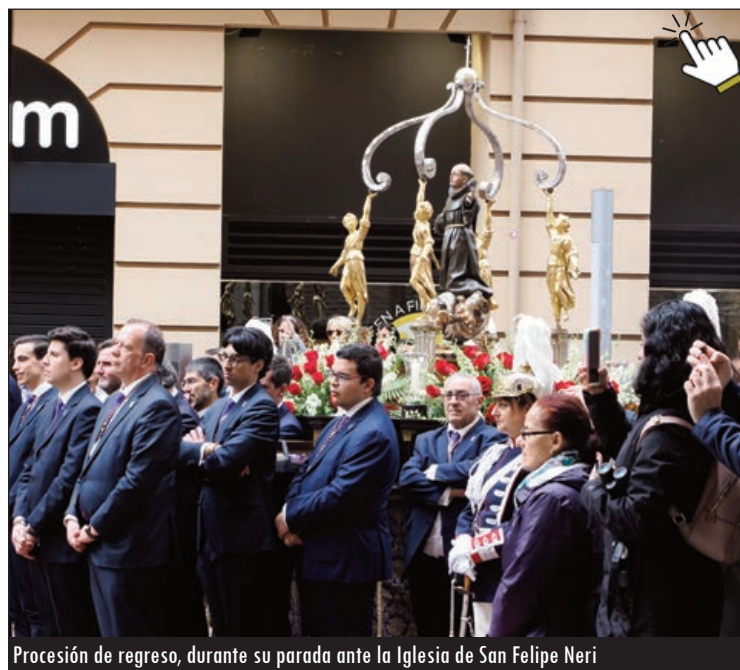
Procesión de regreso, durante su parada ante la Iglesia de San Felipe Neri