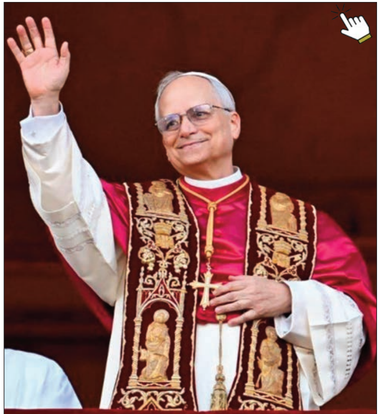
Primer saludo del Santo Padre antes de impartir la bendición 'urbi et orbi'

La palabra "paz" fue una de las palabras más repetidas en el primer discurso de León XIV, quien también