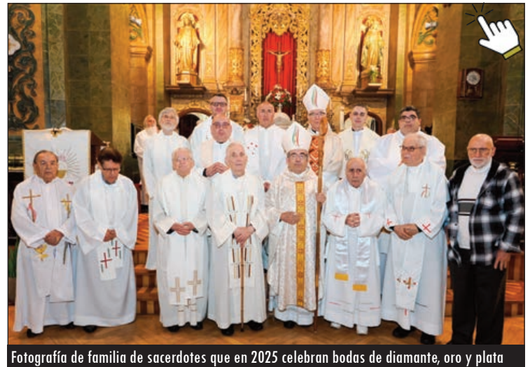
Fotografía de familia de sacerdotes que en 2025 celebran bodas de diamante, oro y plata