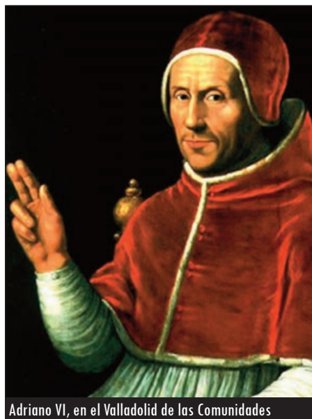
Adriano VI, en el Valladolid de las Comunidades

Este último ha visitado en varias ocasiones la ciudad del Pisuega, desde aquella conmemoración en 2008 del 40º aniversario de la fundación del Estudio Teológico Agustiniense en el histórico seminario de los Agustinos Filipinos de Valladolid, fundado a su vez en 1743, hasta la última en septiembre de 2024 para bendecir la casa de unos amigos que conoció en Perú. Sin duda, una de las casas más representativa de la historia de la Orden de San Agustín es ésta que se