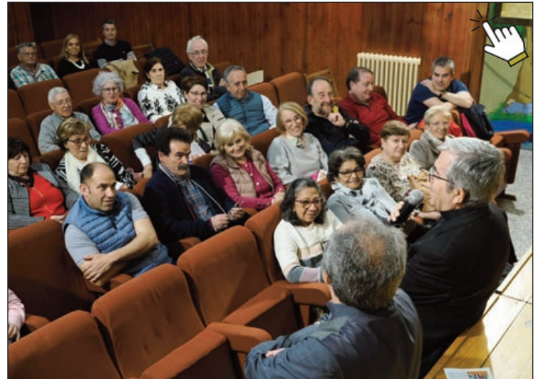
Encuentro en el Colegio La Milagrosa, de Tudela de Duero

Una realidad muy “diversa” que se enfrenta a un ritmo de vida que “dificulta el compromiso social y religioso” para el que es necesario proyectar un