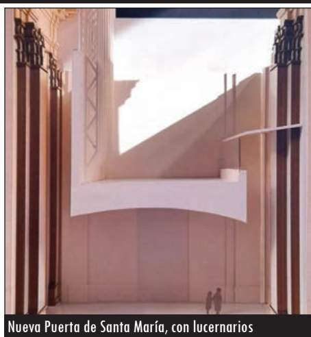
Nueva Puerta de Santa María, con lucernarios

También, y mientras se avanza en la obtención de los permisos y licencias necesarias al tratarse, además, la Catedral de un Bien de Interés Cultural (BIC), el próximo 25 de mayo se procederá al cierre, hasta nuevo aviso, del Museo Diocesano y Catedralicio. A partir de ese día los operarios procederán ya al traslado de obras a otras dependencias,