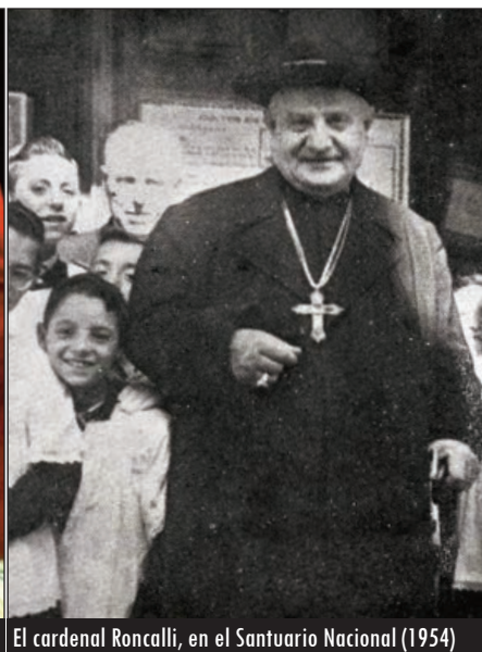
El cardenal Roncalli, en el Santuario Nacional (1954)

encuentra en Valladolid, de las pocas que no fue desamortizada porque su horizonte e interés era la formación de seminaristas para la evangelización de un territorio tan alejado de la Monarquía católica como era el archipiélago de Filipinas.