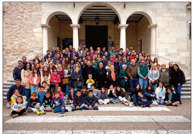
Romería interparroquial de Boecillo y Viana de Cega, coincidiendo con la visita pastoral

El prelado vallisoletano apeló, además, a “ayudarnos unos a otros con una organización concreta que haga más visible nuestra comunión y que ayude a obedecer al Señor, que no envía a ser testigos de la Resurrección y anunciadores del evangelio de la alegría y de la esperanza”. Dos guiños, estos últimos, al magisterio que deja a la Iglesia tras su fallecimiento el Papa Francisco.