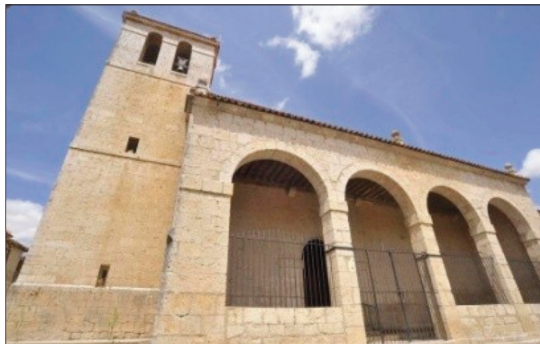
Interior de la Iglesia Parroquial de la Asunción

La patrona de Bercero es Nuestra Señora de la Asunción. Sin embargo, los bercerucos —gentilicio de Berceruelo— celebran las fiestas en su honor en los últimos días de la Semana Santa, en lugar de a mediados del mes de agosto. Estas fiestas, coincidentes con la Pascua de Resurrección, se alargan hasta el sábado y domingo posteriores. Precisamente,