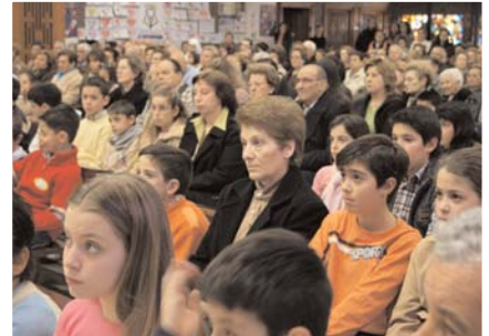
Distintos momentos de la XXIII Semana de la Familia.