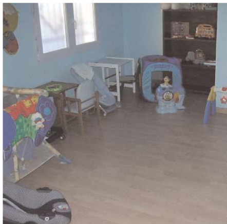
Una habitación de la casa de acogida.

Se trata de una casa que se ha remodelado y adaptado para atender mejor las necesidades de las mujeres y sus hijos con el apoyo económico de la Fundación La Caixa ■