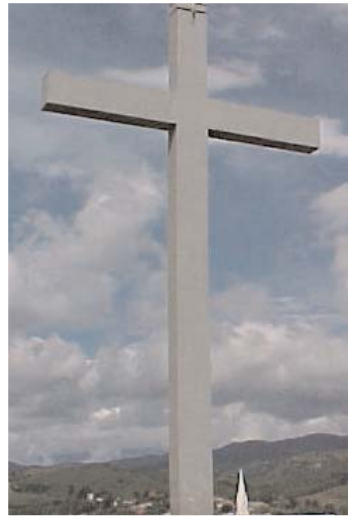
Contempla la cruz.

En su mensaje para la Cuaresma el Papa invita a poner la mirada en la crux donde Dios ha revelado su amor en el corazón traspasado de Cristo, del que manan con el agua y la sangre los sacramentos de Bautismo y la Eucaristía. Llama a acoger ese amor en que se unen el agapé y el eros , que no están contrapuestos, sino que se iluminan mutuamente dentro del amor divino. Agapé es el amor que se entrega gratuitamente, dándonos todo lo que somos como un don, y que, después