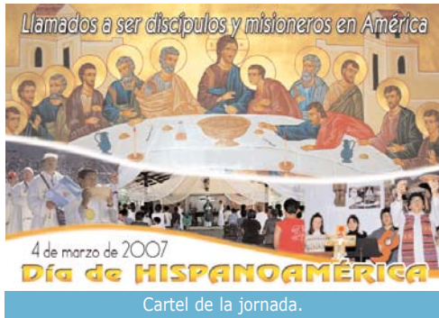
Cartel de la jornada.

El lema "Llamados a ser discípulos y misioneros en América" pretende que los fieles profundicen en el alcance y conteni-