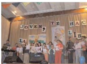
Actuación del año pasado.

PDP. Los días 9 y 10 de marzo se celebrará la XVII Jornada Diocesana de la Juventud y X Festival Joven, que pretende mediante la música, los talleres y la oración crear un camino dinámico en busca de la evangelización que demanda la actual juventud. El viernes 9 de marzo a las 19.30 horas