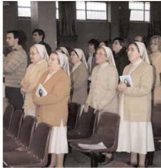
Eucaristía de acción de gracias.