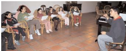
Un primer momento del coro.

PDP. Se ha puesto en marcha el coro diocesano de niños. El primer día los asistentes tuvieron técnica vocal, cantos y una oración final ■