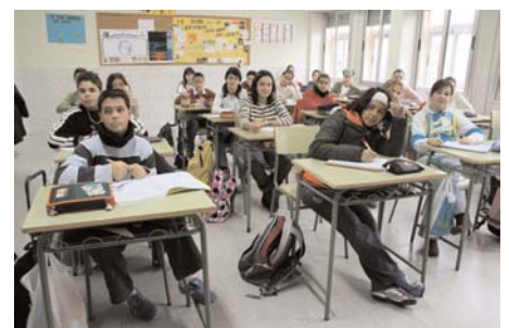
Alumnos del colegio Ntra. Sra. del Carmen.

PDP. En este curso 2006-2007, el 77% del total de alumnos de la escuela española, tanto pública como privada concertada o no concertada, reciben formación religiosa católica. Lo que significa que 5.047.279 alumnos escogen esta asignatura a pesar de las dificultades académicas actuales. Las cifras son sumamente clarificadoras de la opción de los padres ■