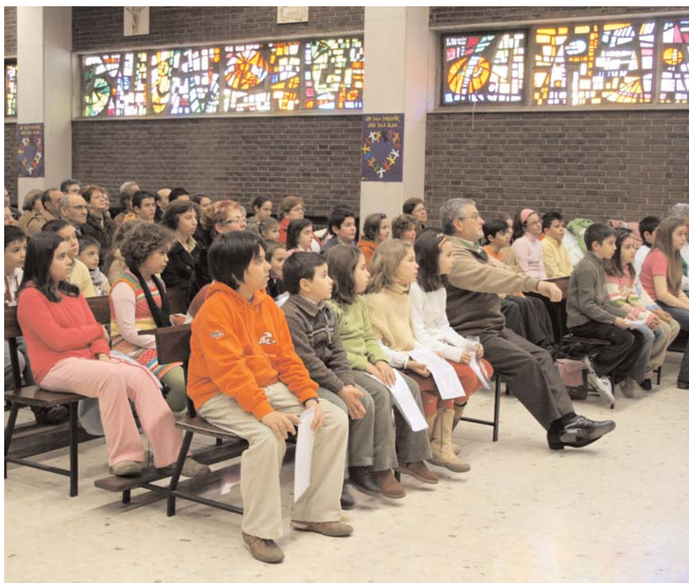
Asistentes a la Eucaristía de clausura de la XXIII Semana de la Familia en la parroquia de San Francisco de Asís. (Foto: Ángel Cantero).

El arzobispo de Valladolid, D. Braulio Rodríguez Plaza, iniciará el jueves 8 de marzo un ciclo de cuatro Meditaciones Cuaresmales, que llevan como título central "Comenzar a pensar de nuevo en Dios y en su Iglesia" y tendrán lugar los cuatro jueves del mes de marzo, a las 20.00 horas, en la parroquia de Santa Clara. Los temas a abordar serán: "Vuelta a Dios por Jesucristo" (jueves 8), "El misterio pascual y la Iglesia" (jueves 15), "Situación de Cristo y de su Iglesia" (jueves 22) y "Discurso a la Iglesia" (jueves 29) ■