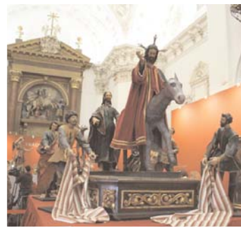
Una de las piezas de la muestra.

Las artes escultóricas y pictóricas son los protagonistas de esta muestra, donde destacan los elementos relacionados