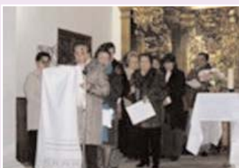
De arriba a abajo: Cena solidaria en los carmelitas de Medina del Campo, rastrillo en San Vicente del Palacio y voluntarias de Manos Unidas en la vigilia de Ataques.