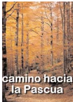
Hacia la Pascua.

Los que se preparan al Bautismo (sus padres, si sus hijos son pequeños), a la Confirmación y a la Eucaristía entran con la Cuaresma en tiempo propicio. Los ya iniciados disponemos igualmente de este tiempo previo a la Pascua que es oportuno para renovar nuestra vida de fe, esperanza y caridad, la vida según el Espíritu que recibimos en la Iniciación cristiana. Tiempo para confesar nuestro pecado, el mal que hemos hecho a los demás que afea a la Iglesia y no acepta el Padre de los cielos. La ceniza nos indica que somos limitados y no hemos de desaprovechar esta Cuaresma, pero sobre todo nos abre el corazón al cambio de mentalidad para vivir el seguimiento de Cristo y su Evangelio.