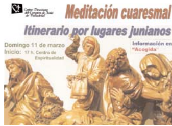
Cartel anunciador del itinerario.

PDP. El 11 de marzo se llevará a cabo una meditación y reflexión itinerante con motivo del V Centenario del nacimiento de Juan de Juni. Se recorren cuatro lugares junianos, con obras de este imaginero relacionadas con temas cuaresmales: la Catedral (con su retablo) meditando sobre el Misterio de Cristo que conduce a la cruz; la capilla de San Francisco del Monasterio de Santa Isabel