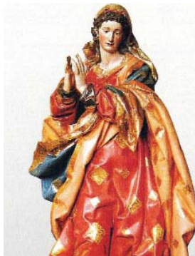
Inmaculada del Seminario.

Estos meses de verano, julio y agosto, los seminaristas se encuentran disfrutando de sus familias en sus casas, a la vez que descansando o aprovechando para realizar otras actividades que