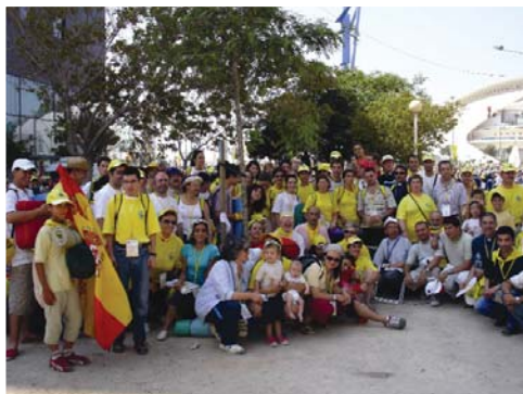
Vallisoletanos en el V Encuentro Mundial de las Familias de Valencia del año pasado.

de la virtud. Pero estamos muy orgullosos de nuestro modo de vivir y quienes se atreven a ir por otras sendas son tachados de todo, y no bueno, por cierto. ¿Podemos estar siempre ufanos de nuestros logros técnicos, de nuestras nuevas formas de conseguir ocio, fiesta y diversión? ¿Para cuándo plantear los interrogantes más profundos? ¿Para cuándo unirse para el bien común y la apertura a los temas globales, como la guerra, el hambre, el morir en África o en América? ¿Abordaremos con más rigor, lejos de ideologías, la verdadera educación de las nuevas generaciones, el despiste de adolescentes y jóvenes? Lo deseo fervientemente ■