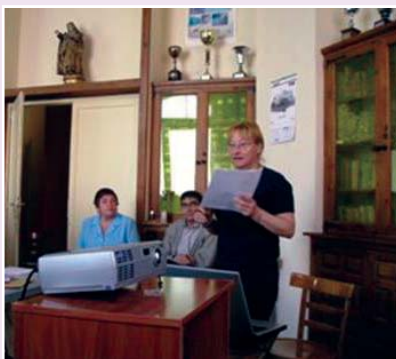
Dos momentos de la asamblea diocesana del 8 de junio.