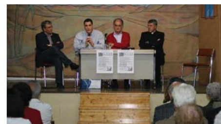
Un momento del memorial.