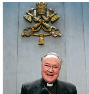
El cardenal Raffaele Martino.

El cardenal Raffaele Martino, presidente