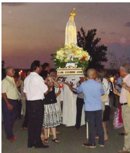
Un alto en la procesión

Se rezó un misterio del Santo Rosario, se cantó La Salve, y todos felices partimos hacia la iglesia parroquial. El pueblo unido por María. Todos en procesión con velas. Las cofradías parroquiales ataviadas de sus estandartes y varas, las asociaciones culturales danzando delante de la Virgen, al son de los instrumentos. Nosotros mostrándola el camino hacia el pueblo y ella mostrándonos el camino hacia Jesús. En medio del camino, la Virgen, "salud de los enfermos", hizo dos paradas. En la iglesia, las campanas repicaban.