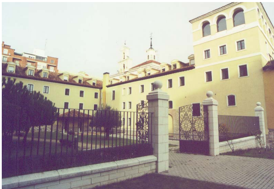
Centro de Espiritualidad

El Centro Diocesano de Espiritualidad inicia el nuevo curso con aquellos personas que buscan profundizar en su fe y e