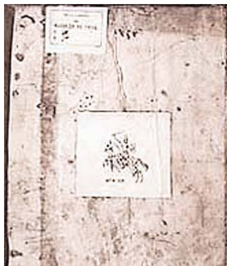
Original del Cantar del Mio Cid

Un total de cinco apartados recorrerán las diferentes etapas de la vida de este personaje tan importante. El primero lleva por título 'Ego Ruderico' y pretende situar al visitante ante la figura del Cid, sirviéndose de abundante material infográfico y