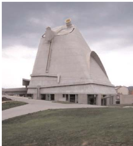
Iglesia de Saint Pierre, en Firminy (Le Corbusier)

VERITAS. Orense ha acogido el I Congreso Internacional de Arquitectura Religiosa, convocado por el Colegio de Arquitectos de Galicia y el Obispado de Orense, en el marco de Año Jubilar de San Rosendo. Un contexto en el que se han destacado las peculiaridades de la arquitectura religiosa y su importancia en el momento actual. El evento ha sido un homenaje al arquitecto Ignacio Vicens, que busca la incorporación del lenguaje moderno a los espacios del culto ■