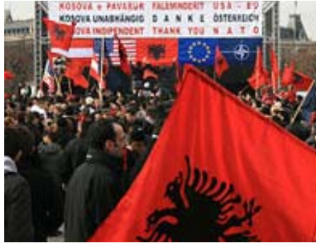
Kosovares celebrando su independencia

Un llamamiento dirigido en particular a los políticos serbios y kosovares con el fin de evitar reacciones extremistas que provoquen violencia