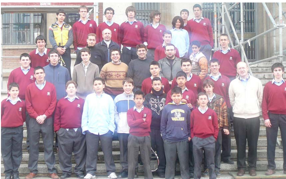
Alumnos y profesores del Seminario Diocesano