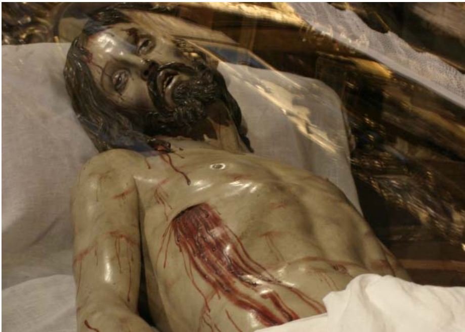
'Crsito Yacente' de la Iglesia de San Miguel, obra de Gregorio Fernández