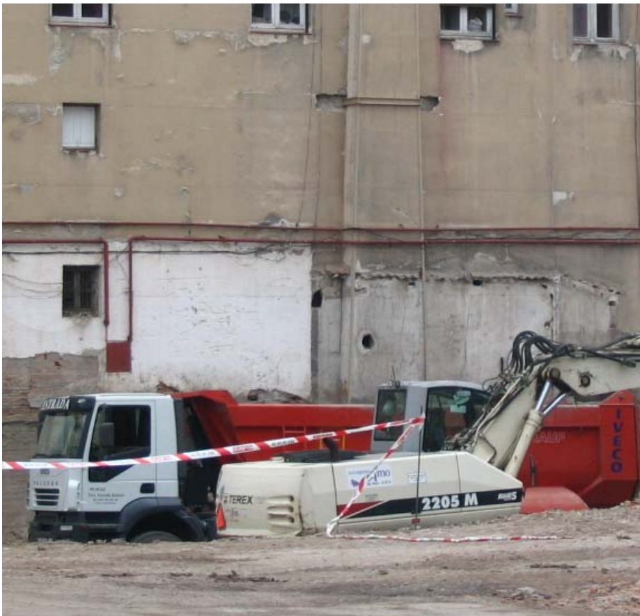
Una de las máquinas realizando trabajos sobre el terreno

-7ª La Fundación cede sus instalaciones y presta servicios a diversas instituciones, que se encuentran dentro del objeto de la Fundación como el Colegio de Niños Sordos, la Asociación de Sordos, Espre, Secretariado Gitano, Cáritas Diocesana y la Comunidad de las Hermanas Oblatas ■