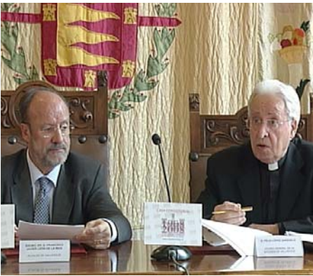
El Alcalde y el Vicario General en la firma

mcs. El Ayuntamiento y el Arzobispado de Valladolid han firmado un convenio de colaboración para ampliar el horario de apertura en determinadas épocas del año de doce templos de la ciudad con el fin de facilitar el acceso a los visitantes.