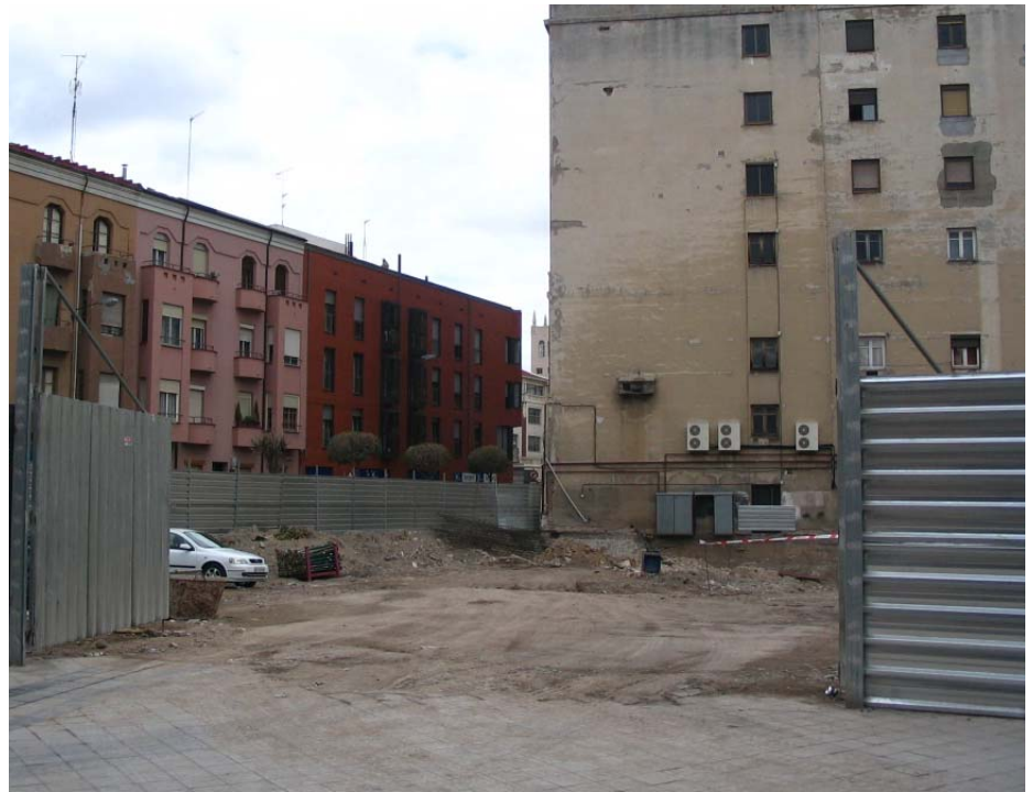
Situación actual de las obras en el terreno ubicado en la calle José María Lacort