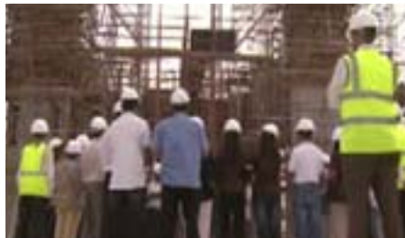
Trabajadores en la construcción de la Iglesia

ZENIT. Más de 6.000 fieles se unieron en la inauguración de la primera iglesia católica en el emirato árabe de Qatar. En representación de Benedicto XVI, la celebración fue presidida por el cardenal Ivan Dias, prefecto de la Congregación Vaticana para la Evangelización de los Pueblos.