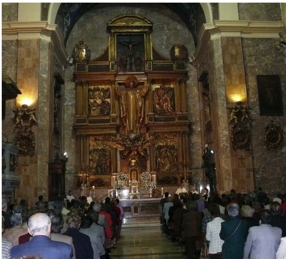
Un momento de la Vigilia por la vida celebrada el pasado 5 de abril en Valladolid

El Programa para el Sostenimiento de la Iglesia, de la CEE, ha puesto en marcha la Campaña de la Renta 2008 con el objetivo de animar a los católicos y a todas las personas que reconozcan la labor de la Iglesia, a marcar la X en la Declaración del IRPF. A través de la marca Xtantos se explica el nuevo sistema de asignación tributaria y la labor que desempeña la Iglesia en la sociedad. Los Consejos Económicos de las parroquias de nuestra Diócesis están trabajando activamente para informar a los fieles de ambos aspectos ■