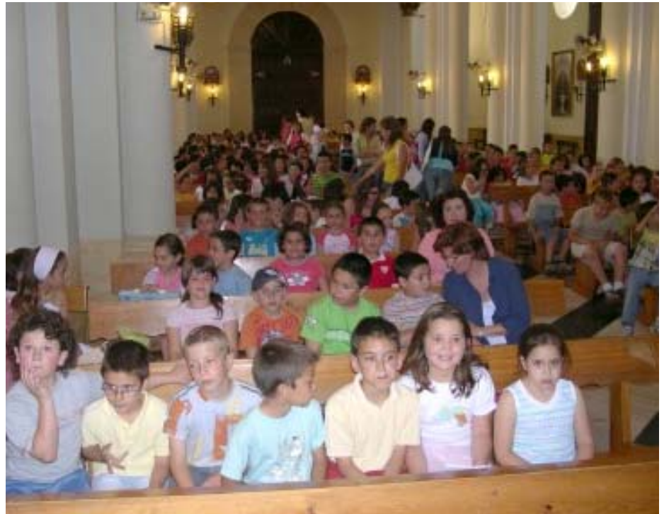
Varios grupos de niños y niñas recibiendo catequesis

El pasado 7 de abril la Conferencia Episcopal Española presentó a nivel nacional éste nuevo catecismo. El próximo 21 de abril, la Delegación de Catequesis de Valladolid, hará lo propio, presentando 'Jesús es el Señor' a todos los miembros de la Diócesis