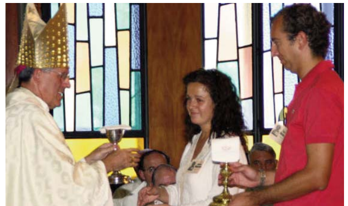
El Arzobispo recibiendo las ofrendas del Pan y el Vino