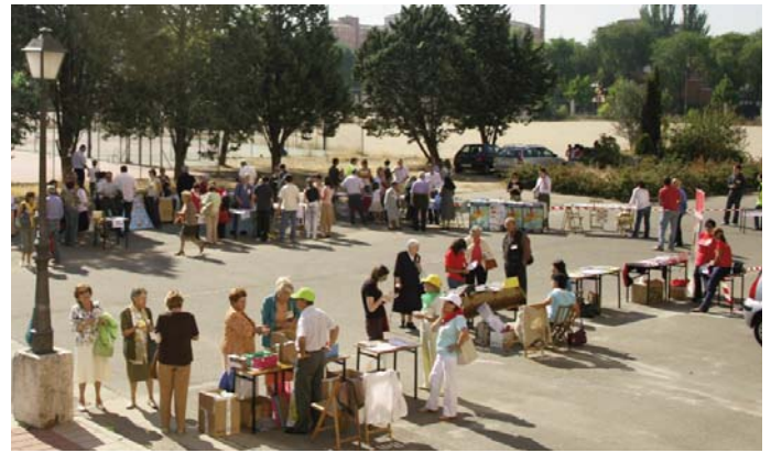
Exposición de actividades de los movimientos y asociaciones