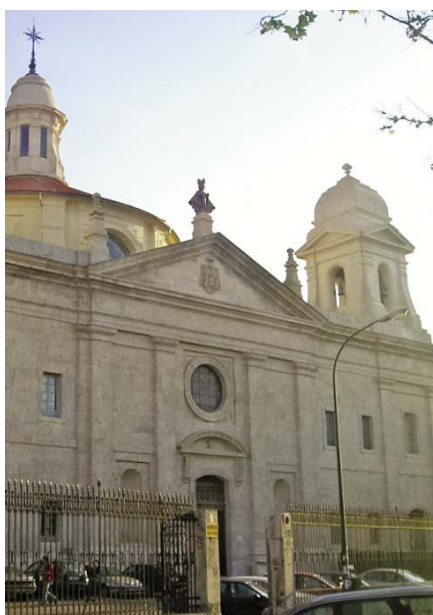
Fachada de la Parroquia de san Agustín

Con el nuevo Plan Pastoral, las parroquias del arciprestazgo Centro trabajan para constituir equipos arciprestales de iniciación cristiana, formación bíblica y diálogo fe-cultura. De hecho, contarán próximamente con varias programaciones pastorales conjuntas ■