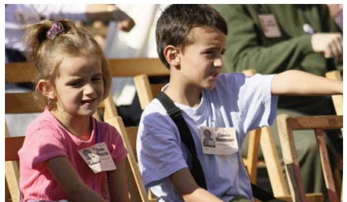
Los más pequeños también disfrutaron de la jornada