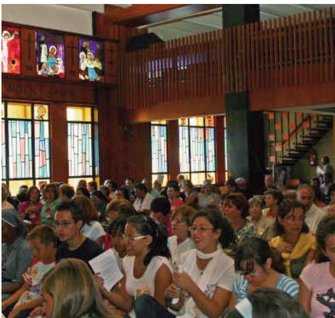
Un momento del ensayo de cantos para la Eucaristía