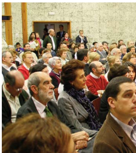
La participación de los fieles de Valladolid durante todo el acto fue muy numerosa