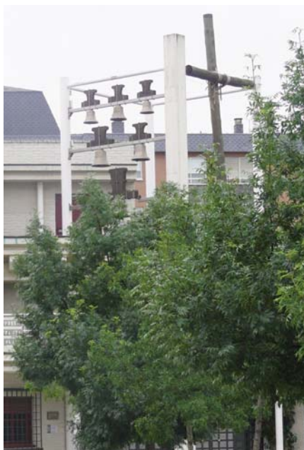
Parroquia de Nuestra Señora del Henar

En este arciprestazgo, existen zonas muy nuevas y dispersas que dificultan la atención pastoral. En este sentido, sería necesario la creación de un centro de referencia en la nueva urbanización de Villa del Prado que forma parte de la parroquia de San Pascual Bailón ■