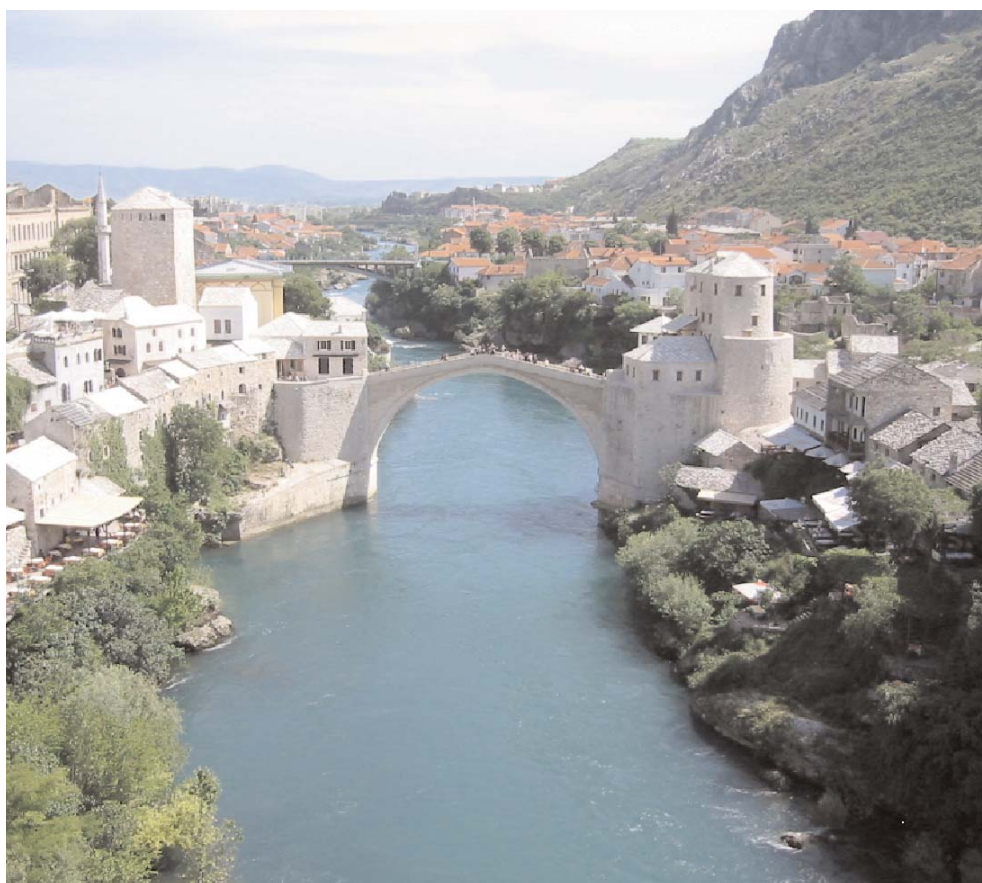
Ponte Viejo en la ciudad de Mostar (Mostar), reconstruido en 2004 como símbolo del diálogo interreligioso

Es una de las fiestas más importantes del calendario litúrgico, porque celebramos que Cristo es el Rey del universo. Su Reino es el de la verdad y la vida, de la justicia, del amor y la paz. La fiesta de Cristo Rey fue instaurada por el Papa Pío XI el 11 de Marzo de 1925. Posteriormente se movió la fecha de la celebración dándole un nuevo sentido: al cerrar el año litúrgico con esta fiesta se quiso resaltar la importancia de Cristo como centro de toda la historia universal. Es el alfa y el omega, el principio y el fin. ¡Prepárate para la fiesta del Rey del universo! ■