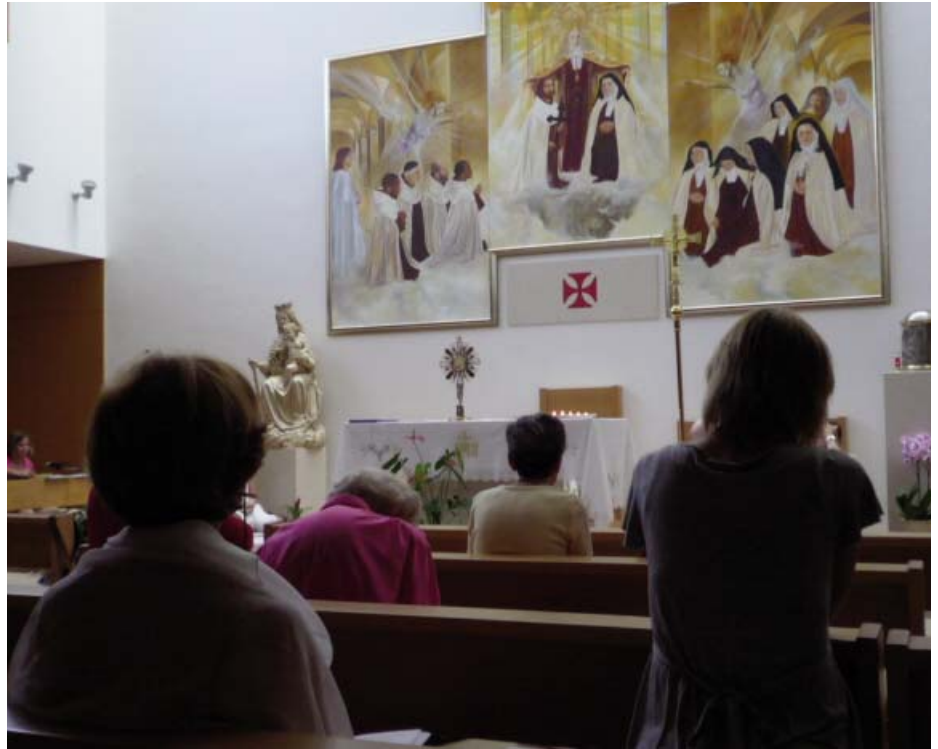
Un grupo de fieles adorando al Santísimo Sacramento

La Diócesis de Valladolid ofrece la Adoración Eucarística Perpetua, las 24 horas al día, los 365 días al año. De este modo, los fieles vallisoletanos podrán adorar al Señor sin interrupción, el mayor honor y gloria que, como familia eclesial, se puede rendir a Dios