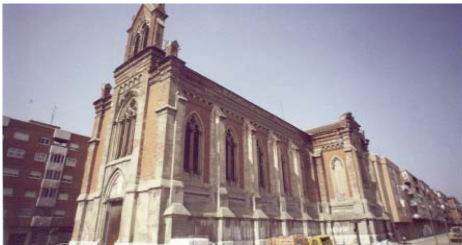
Parroquia Nuestra Señora del Pilar, conocida como "La Pilarica"

Por otra parte, el arciprestazgo se caracteriza por su programación pastoral arciprestal, a través de la cual se desarrollan varias actividades conjuntas realizadas por todas las parroquias ■