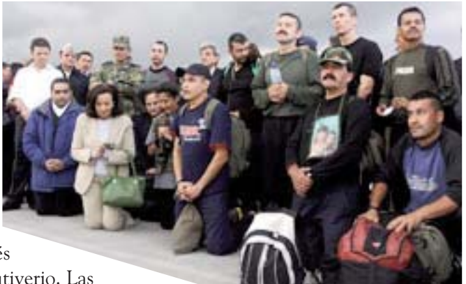
LOS RECIÉN LIBERADOS, JUNTO CON ALGUNOS FAMILIARES, REZAN TRAS LLEGAR AL AEROPUERTO MILITAR DE BOGOTÁ