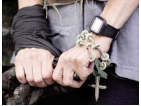
INGRID BETANCOURT, POCO ANTES DE SUBIR AL HELICÓPTERO. EN LA MUÑECA, EL ROSARIO QUE ELLA MISMA SE HIZO, CON BOTONES (LIANAS), DURANTE EL CAUTIVERIO

7. Ahora no puedo olvidar que dejo tras de mí a muchos seres humanos, víctimas de