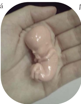
EL “BEBÉ-AÍDO”, QUE REPRESENTA A UN FETO DE DOCE SEMANAS. MÁS INFORMACIÓN EN: WWW.BEBE-AIDO.COM

El Catecismo de la Iglesia Católica enseña, en el número 2258, algo que, hoy día y en España, debe ser tenido muy en cuenta: “ La vida humana es sagrada,