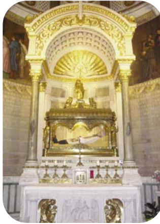
SEPULCRO DEL CURA DE ARS

He dedicado mis dos primeras cartas a glosar la que Benedicto XVI nos escribió a los sacerdotes, como inicio del Año Sacerdotal . El mes pasado expuse una pequeña semblanza de la vida del santo Cura. A partir de hoy me parece muy conveniente exponer, citar y comentar su doctrina tan excelente, recogida por testigos de su vida, y también la contenida en sus Sermones. Tales expresiones son para leerlas pausadamente y mejor ante el sagrario donde está verdadera, real y sustancialmente presente Jesucristo.