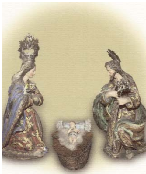
"NACIMIENTO". LUISA ROLDÁN (LA ROLDANA, s. XVII) PALACIO EPISCOPAL DE SEVILLA

La Junta de la Hospitalidad de Nuestra Señora de Lourdes de esta Archidiócesis de Valladolid pide, en estos días de Navidad y durante el año 2010, para Ud. y los suyos, a la Sagrada Familia de Nazaret, Jesús, María y José, la felicidad que solamente Ellos pueden dar.