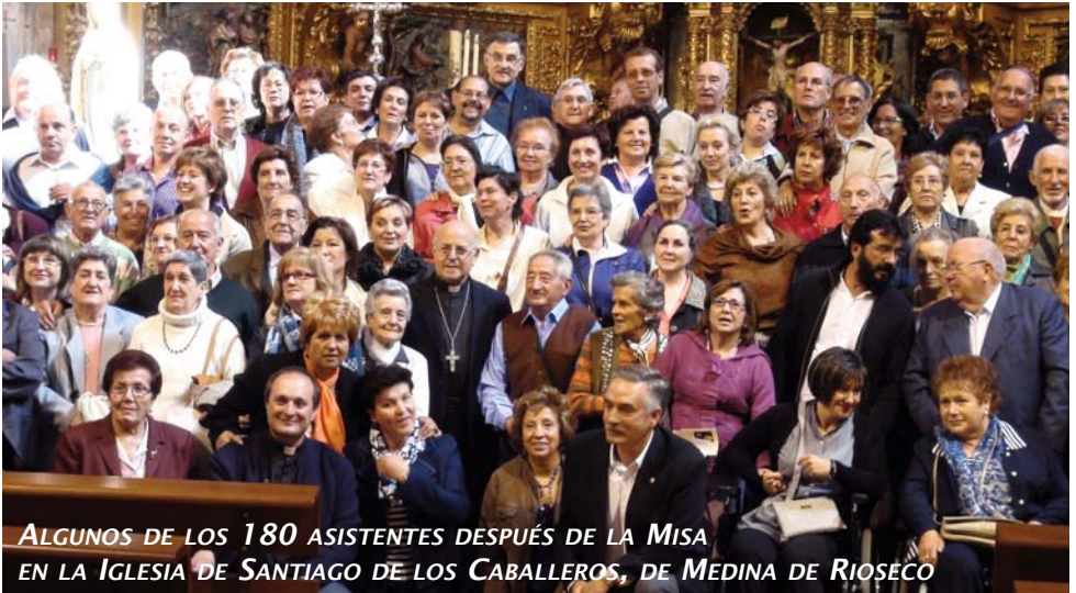
ALGUNOS DE LOS 180 ASISTENTES DESPUÉS DE LA MISA EN LA IGLESIA DE SANTIAGO DE LOS CABALLEROS, DE MEDINA DE RIOSECO